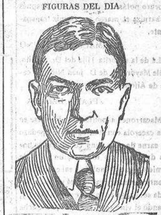
Mr. John D. Rockefeller, distinguido filántropo norteamericano uno de los candidatos con más probabilidades de ser nombrado alcalde de New York