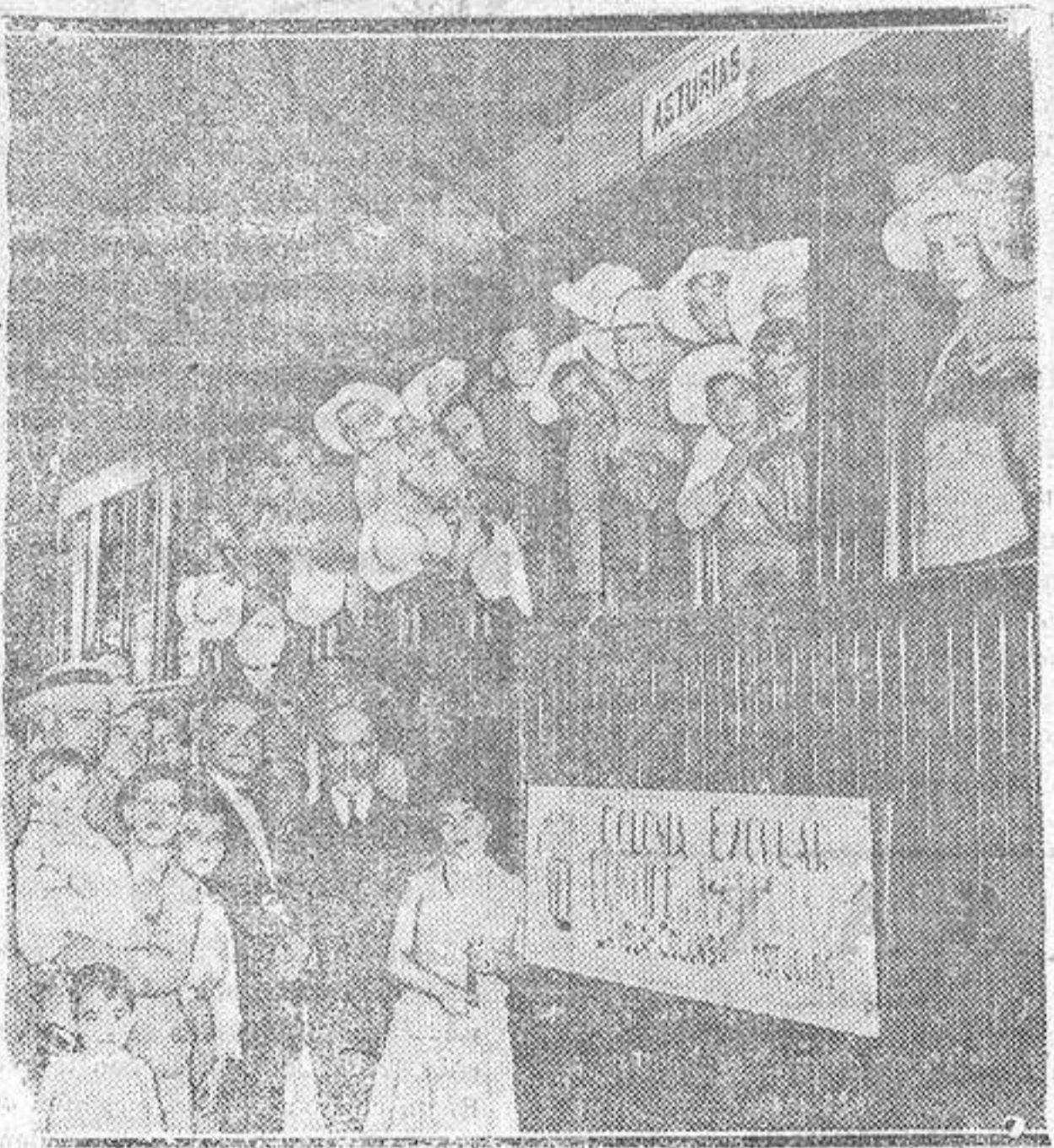
Los niños que constituyen la colonia escolar Príncipe de Asturias de Madrid en el tren en que marcharon ayer a la Isla Colunga (Asturias)