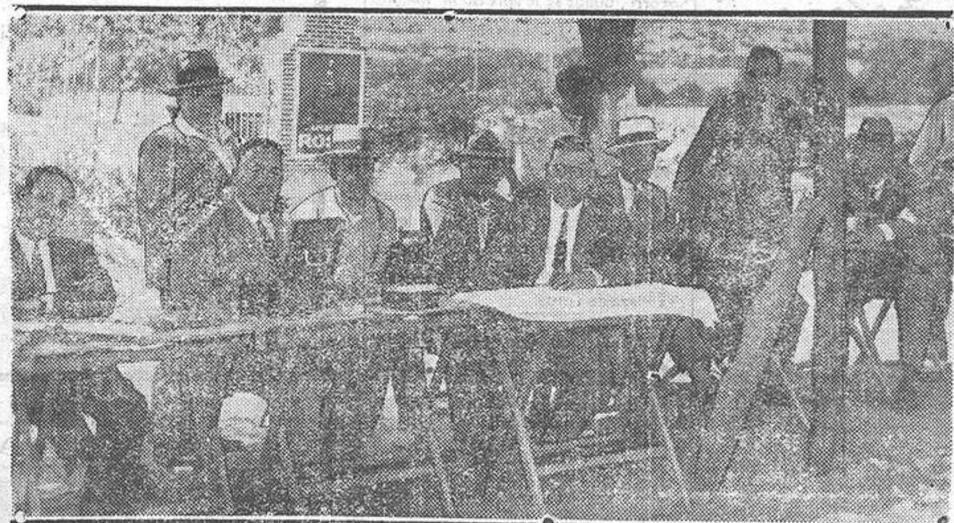
El control de Guadarrama, donde iniciaron y terminaron la carrera los participantes en las XII horas del Real Moto Club de España.