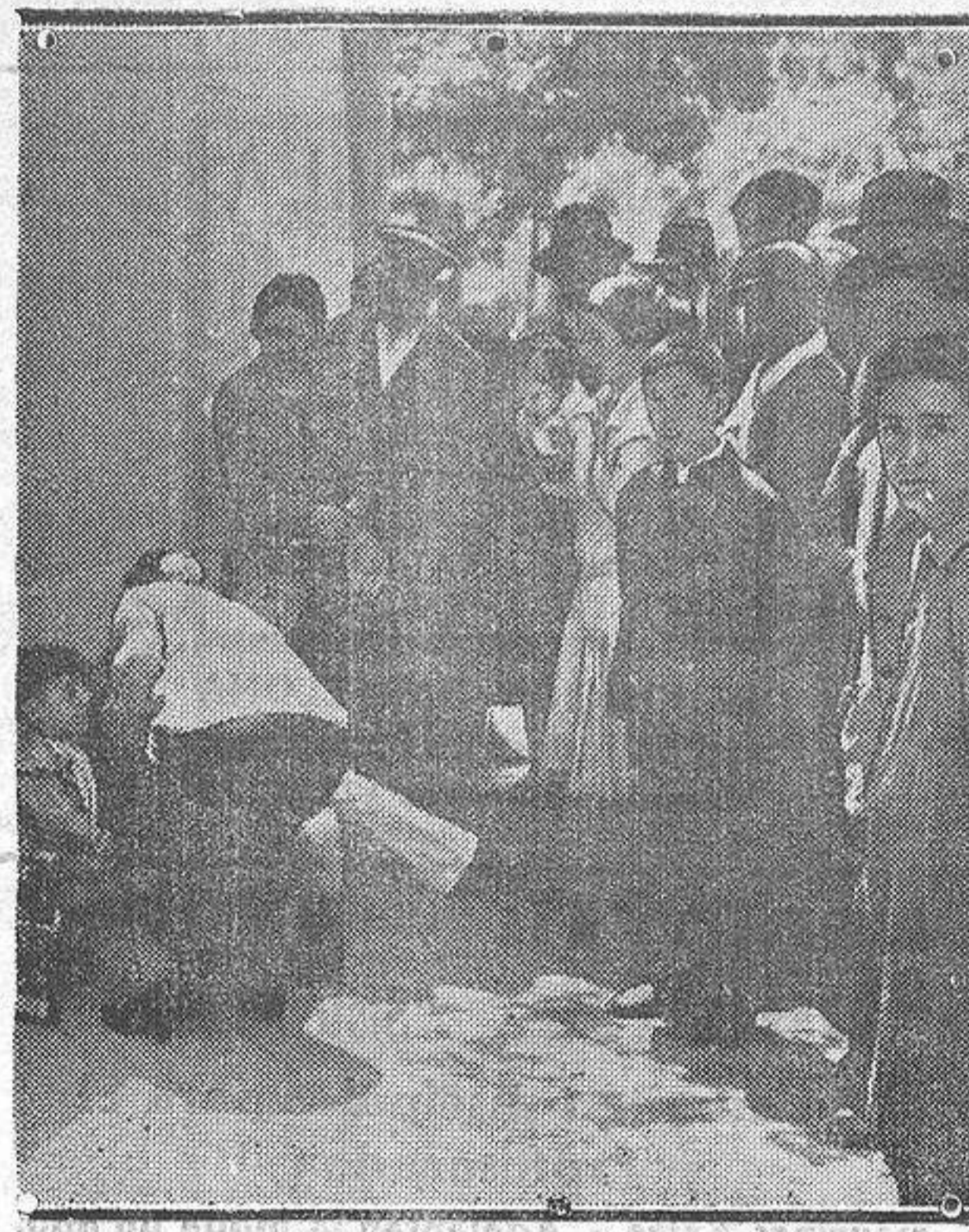
Enfermos, rodeados de curiosos, que esperaban a la puerta del pabellón de los marqueses de Bermejillo del Rey, donde se hospeda el doctor A-sue-ro, a ser asistidos por el popular médico donostiarra.

informes que desee u ordenar una visita de inspección al establecimiento de que se trate. Los que aspiren al título en cuestión, deberán dar cuantas facilidades sean posibles para que el Patronato obtenga la más completa información sobre el funcionamiento de aquél.