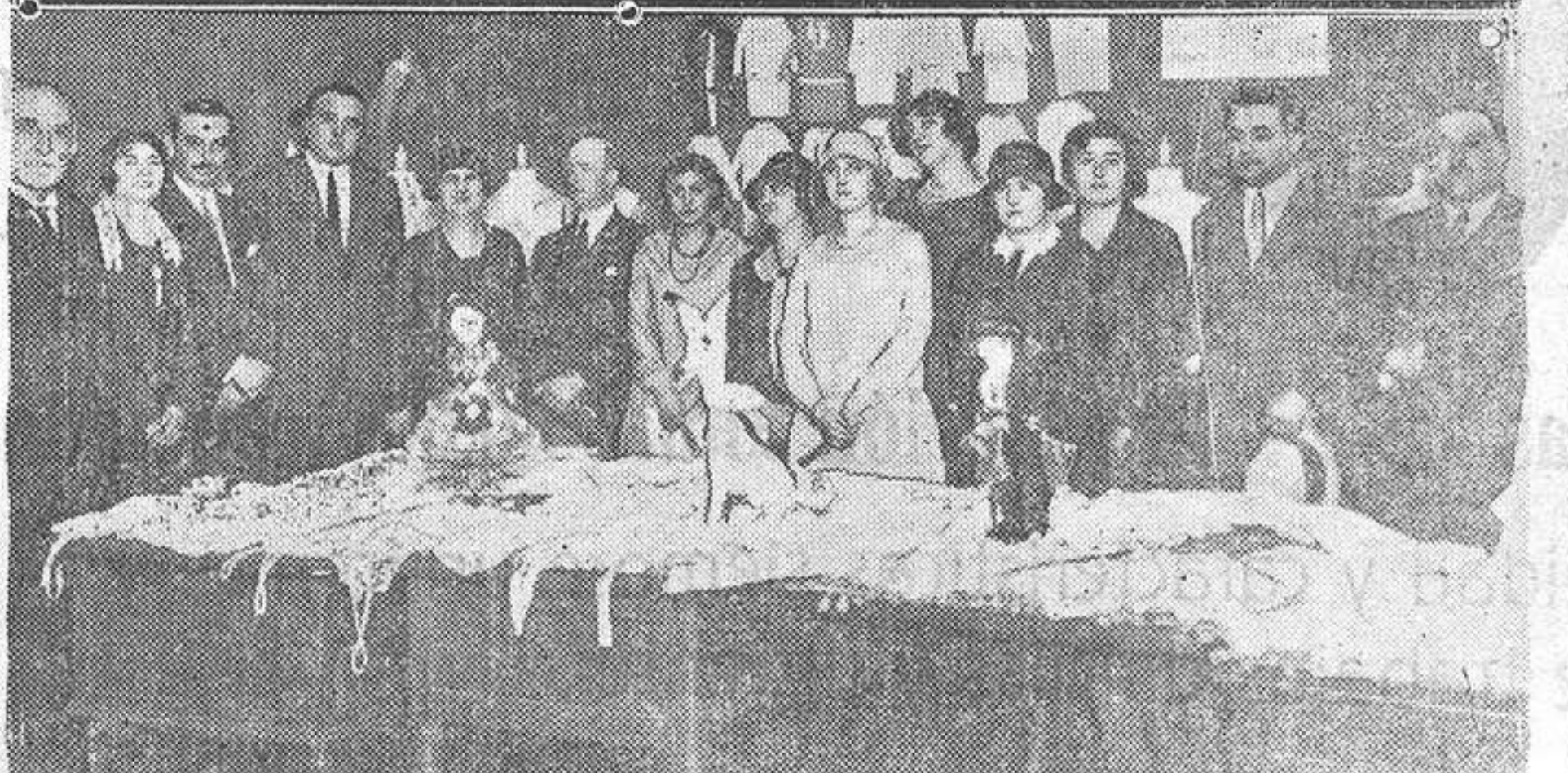
Los ministros de Instrucción Pública y Trabajo durante la visita que hicieron ayer a la Exposición de labores organizada por la Acción de la Mujer.