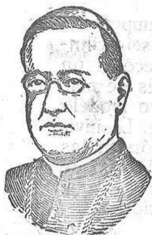
El cardenal Donato Sbarretti, Obispo de Sabina, de la Sacra Congregación del Concilio, que acaba de celebrar sus bodas de plata con la iglesia

EL «DIARIO» ES EL PERIODICO DE MAYOR CIRCULACION DE LA NOCHE