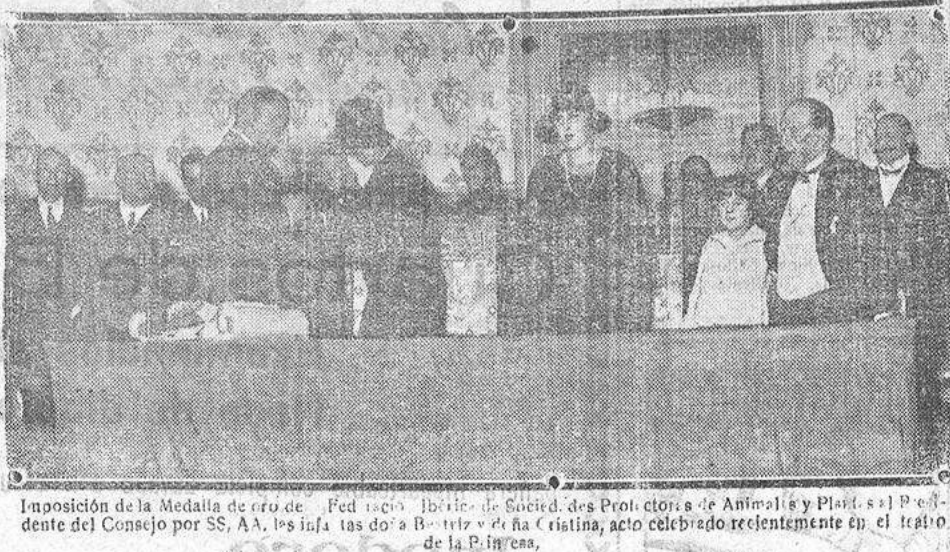
Imposición de la Medalla de Oro de Federico Ibrico de Sordos, de los Protectoras de Animales y Plantas, Presidente del Consejo por S. S. A. A. los infantes don B. Ibrico y don C. Ibrico, acto celebrado recientemente en el teatro de la P. Ibrica.

Los rejoneadores se lucieron en sus faenas siendo aplaudidos.