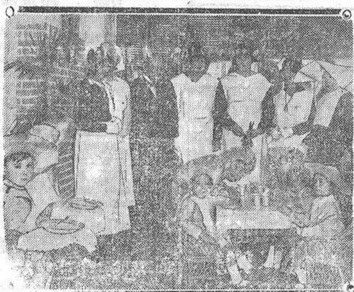
Sus Altezas las infantas doña Beatriz y doña Cristina repartiendo la comida a los niños pobres en el comedor de caridad de la calle de Martínez Campos.