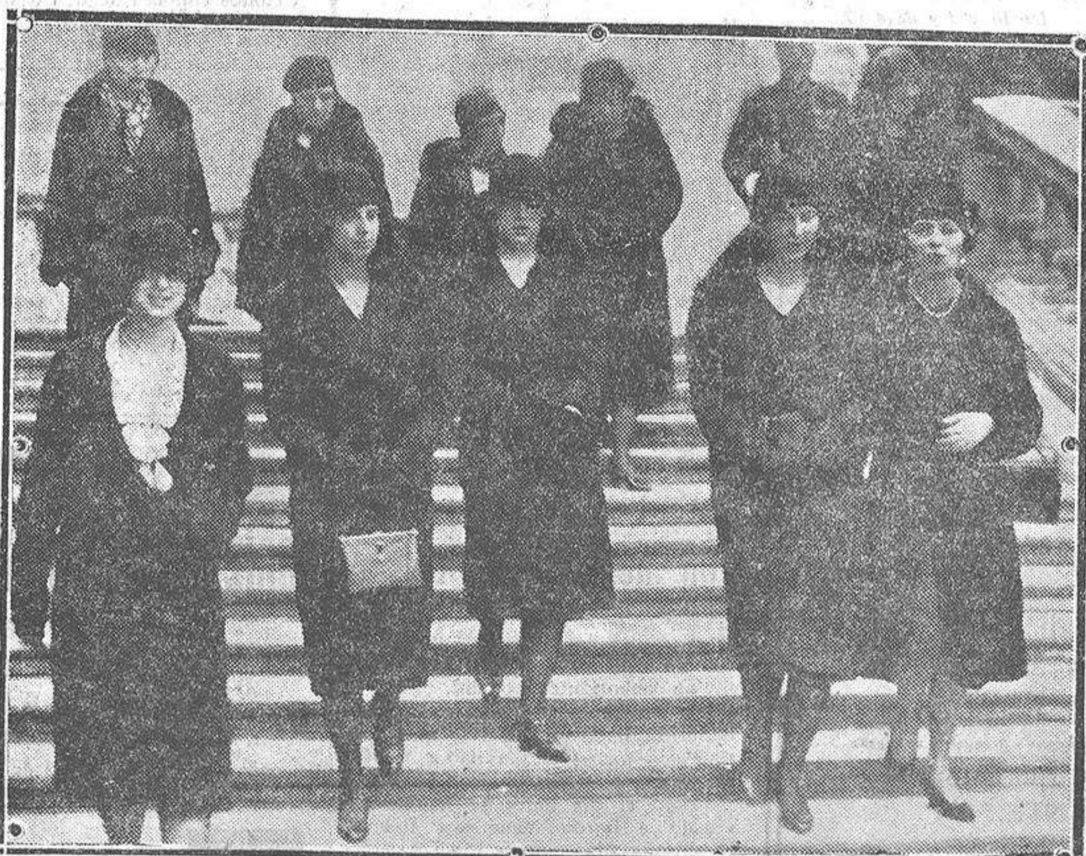
La princesa Elena, la infanta Beatriz, la princesa de Salm Salm, la infanta Cristina y la princesa de Hohenzollern, después de su visita al Museo del Prado.