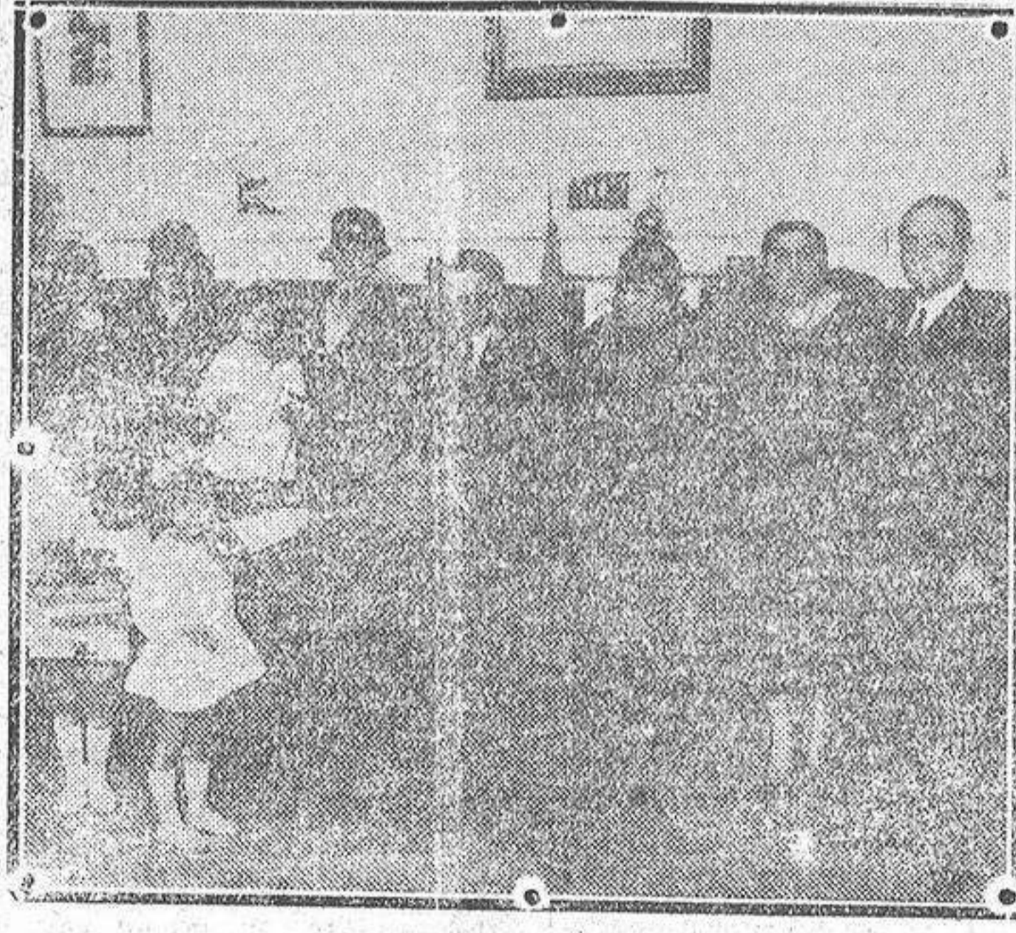
Reparto de ropas y juguetes a los niños que asisten al Grupo Escolar Peñalver, acto celebrado anteayer