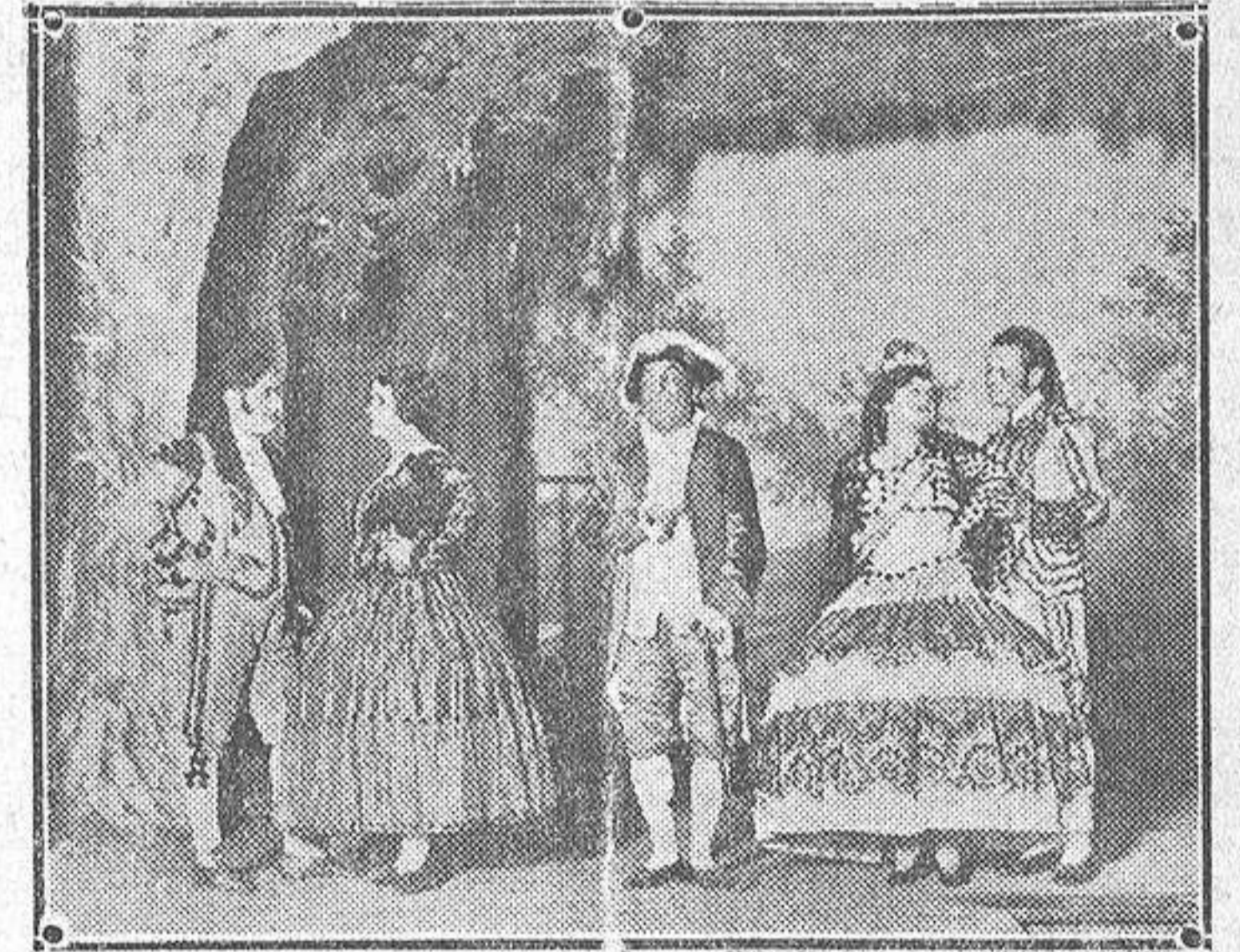
Una escena de «Paca la Morena», obra estrenada en Novedades de Madrid