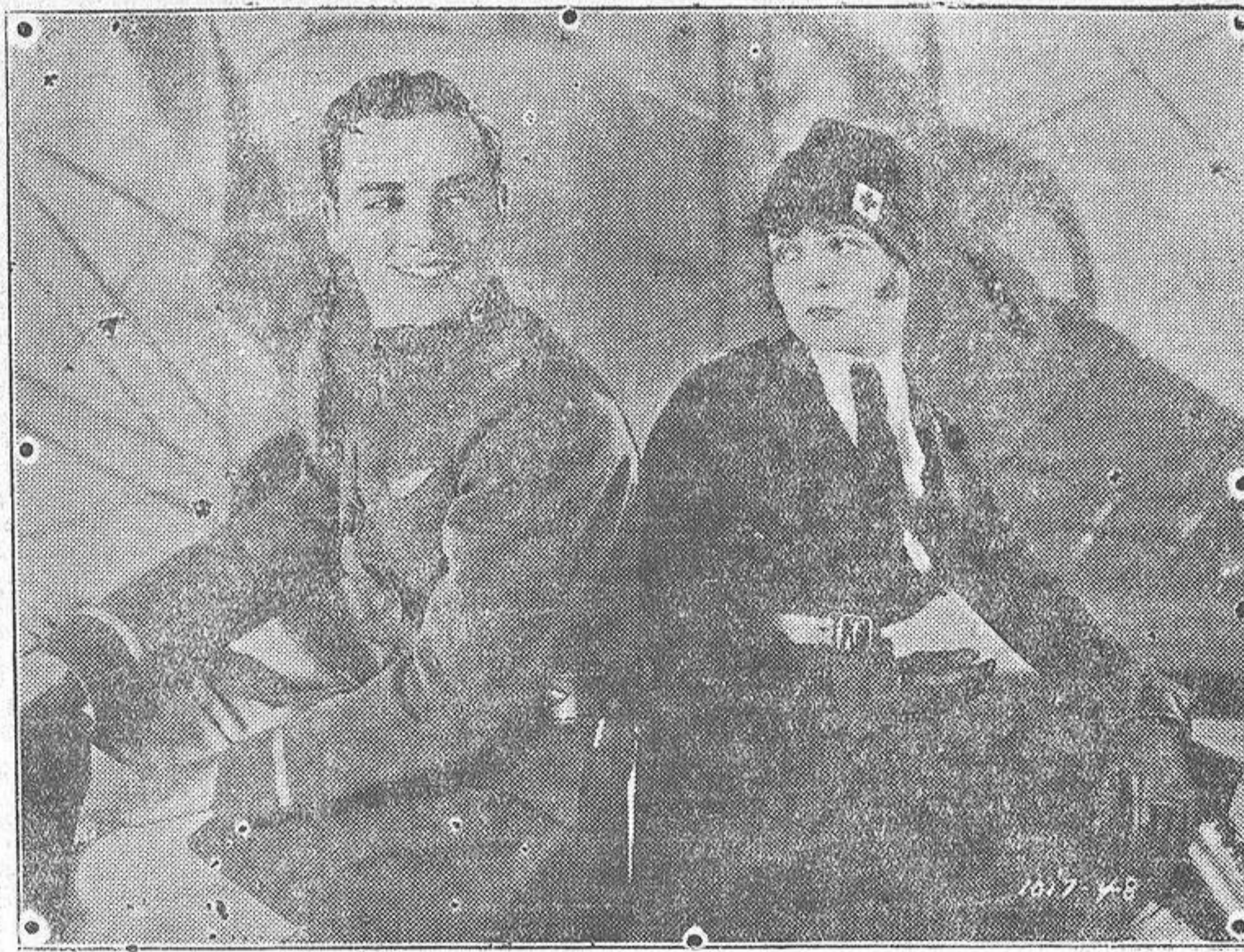
Una escena de ALAS, en la que figuran los dos principales intérpretes.