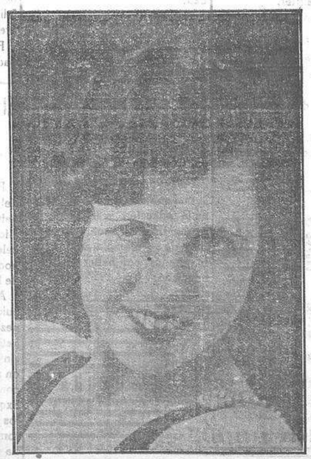
Admirable bailarina BELLEZA