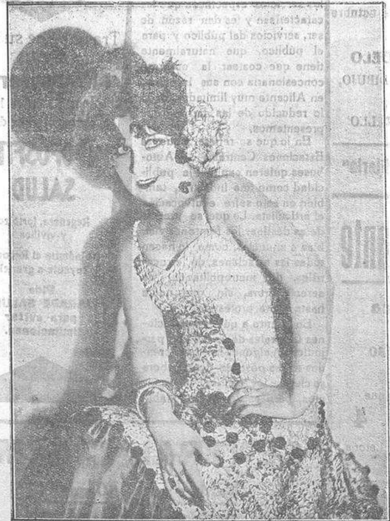
Estrella de la canción ARTE