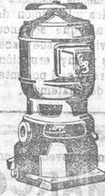
Con motor monofásico para casas particulares hasta 900 litros por hora y 17 metros de altura manométrica.