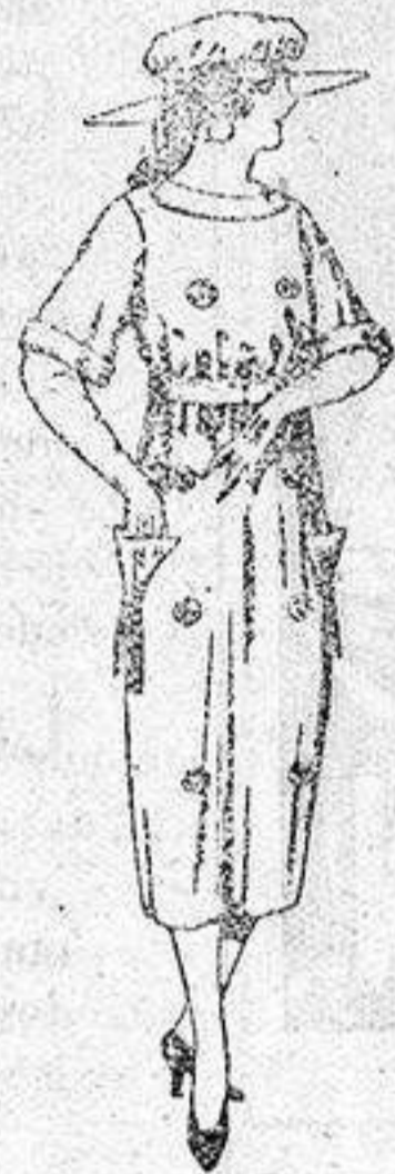
Vestidos de sarga inglesa, estambre, etc., en azul y colores, adornos bordados, de ptas. 55 a 62.