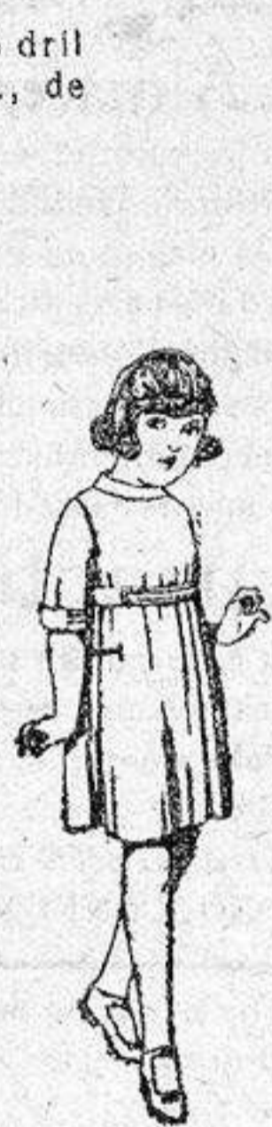
Vestidos de sarga inglesa azul, y adornos sarga blanca, para niñas de 4 a 9 años, de ptas. 36 a 40.