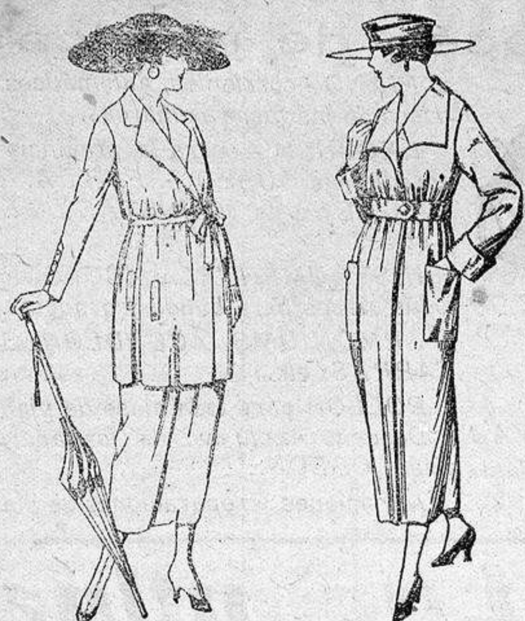
Trajes de estambre, lana, etc., en negro, azul y color, de ptas. 120 a 135.

SUCURSALES: Madrid, Barcelona, Almería, Bilbao, Cádiz, Cartagena, Gijón, Granada, Málaga, Palma de Mallorca, Santander, Sevilla, Valencia, Valladolid y Zaragoza.