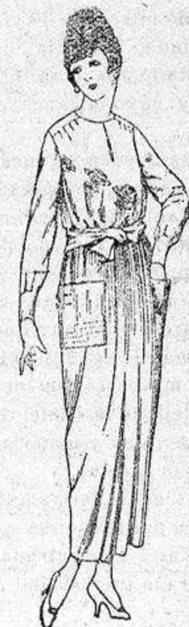
Blusas de crespón, voile, etc., en negro, azul y color, adornos bordados, de ptas. 17 a 22. Faldas de lanilla, estambre, gabardina, etc., en negro, azul y colores, de ptas. 28 a 36.