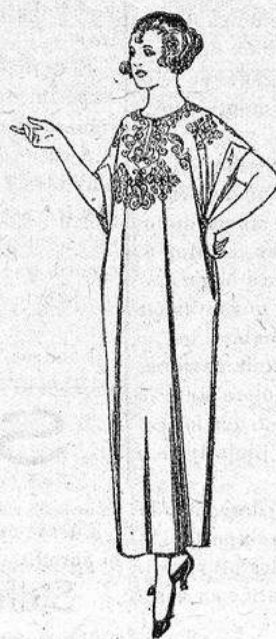
Batas de crespón, voile, etc., adornos bordados, de ptas. 14 a 22.