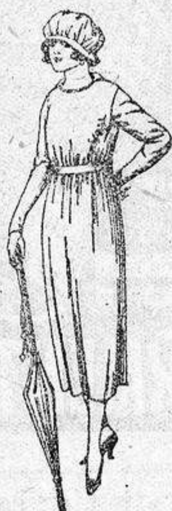
Vestidos de estambre, lanilla, etc., en azul y colores, adornos bordados, de ptas. 57 a 65.