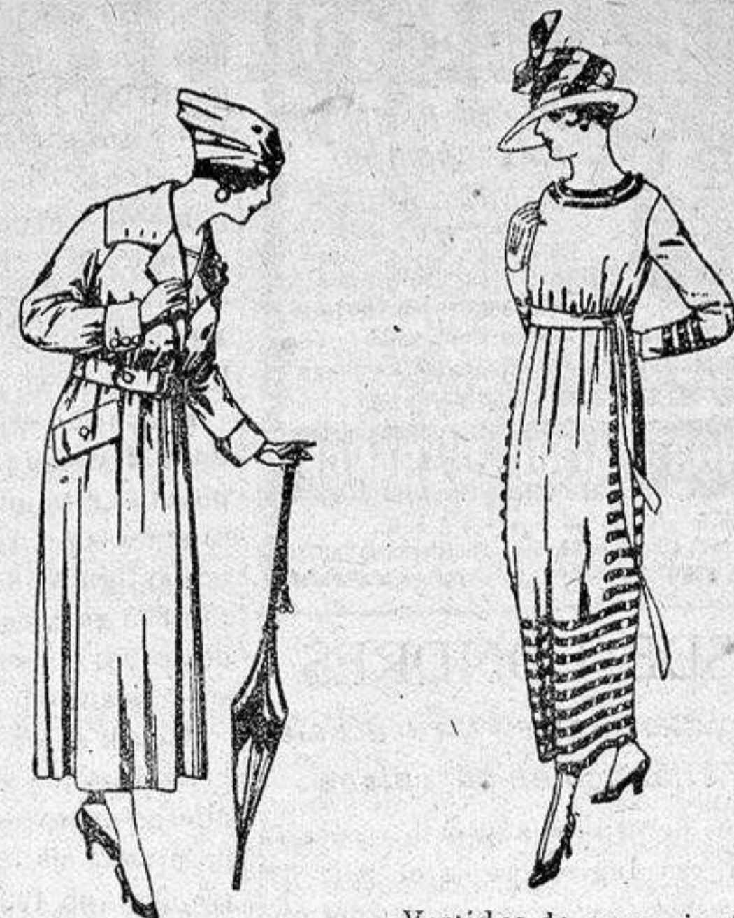
Abrigos de gabardina inglesa, impermeabilizados, diferentes colores, de ptas. 85 a 150.