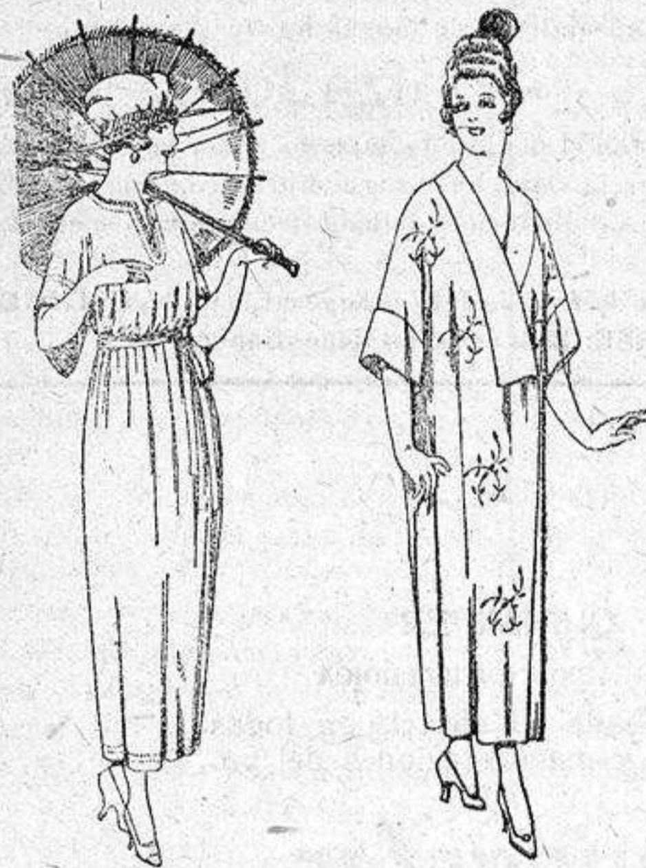
Vestidos de voile blanco y color, adornos bordados, de pesetas 45 a 58.