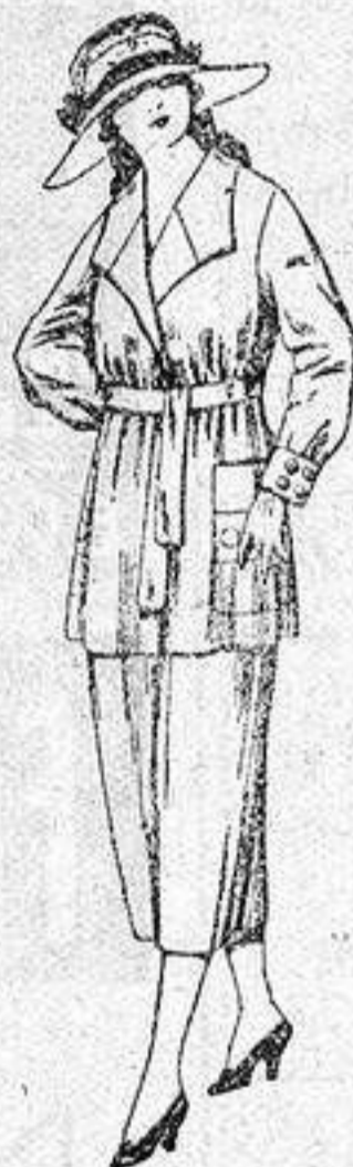
Trajes de estambre, gabardina, etc., en azul y color, de ptas. 68 a 79.