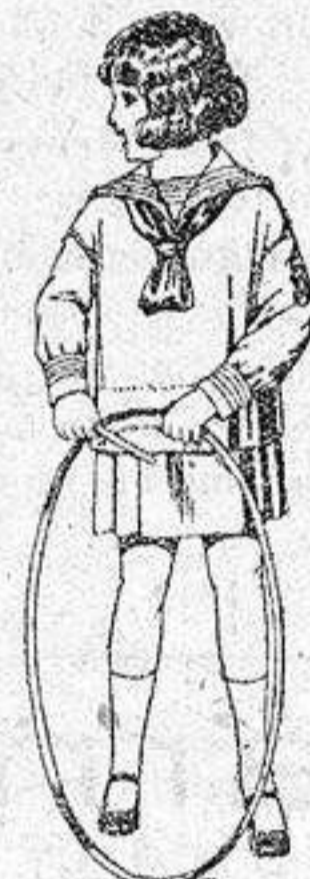
Trajes modelo «Marinera» inglesa, de estambre o jerga azul, para niños de 4 a 9 años de pesetas 30 a 42.