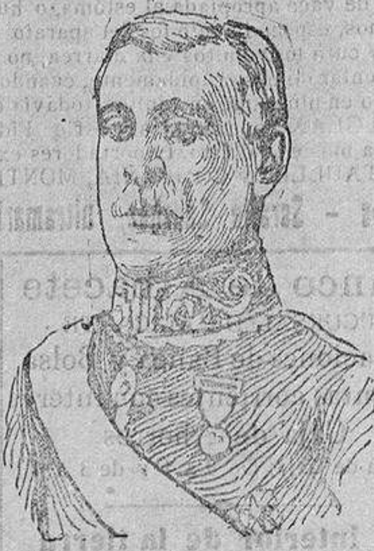
FIGURAS DEL DIA