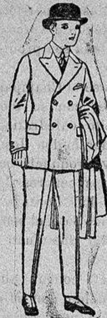
Trajes de patén, y vicuña etc. para niños y jovencitos de diez a dieciséis años. De ptas. 32 a 65

ULTIMA NOVEDAD en echarpes, manguitos, pelerinas, corbatas, abrigos etc. en pieles de lontre, taupe, visón renard, zibeline, armino, etcétera auténticos e imitación perfecta.