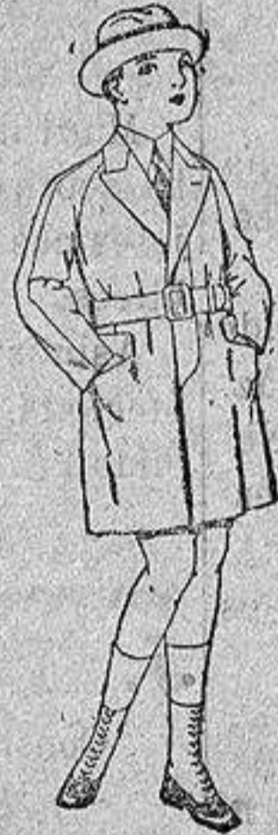
Gabanes de patén gamuza etc. para niños de 4 a 12 años. De ptas. 30 a 65.