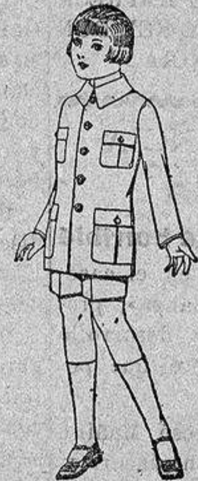
Trajes de patén, modelo sport, para niños de 4 a 9 años. De ptas. 23 a 35