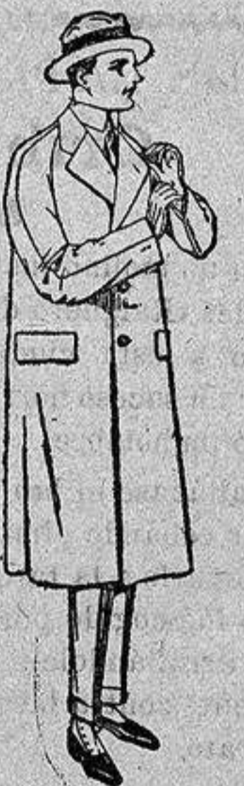
Gabardinas impermeabilizadas. De ptas. 127 a 190.