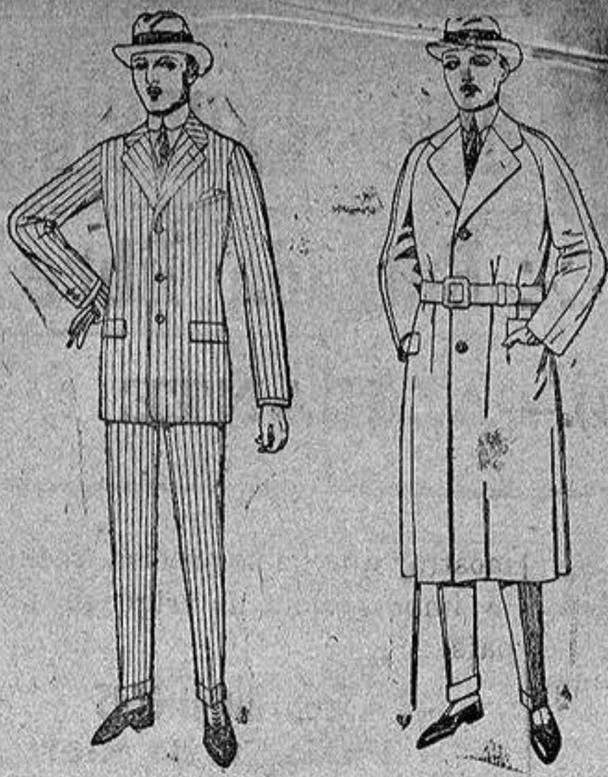
Trajes de melton, cheviot, estambre, etc. De ptas. 38 a 150

Sucursales.—Madrid, Barcelona, Almeria, Bilbao, Cadiz, Cartagena, Gijón, Granada, Málaga, Palma de Mallorca, Santander, Sevilla, Valencia, Valladolid, Zaragoza