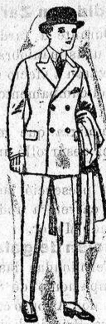
Trajes de patén, y vicuña etc. para niños y jovencitos de diez a dieciséis años. De ptas. 32 a 65