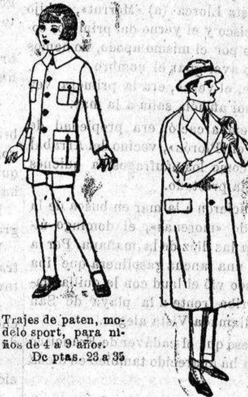
Trajes de patén, modelo sport, para niños de 4 a 9 años. De ptas. 28 a 35