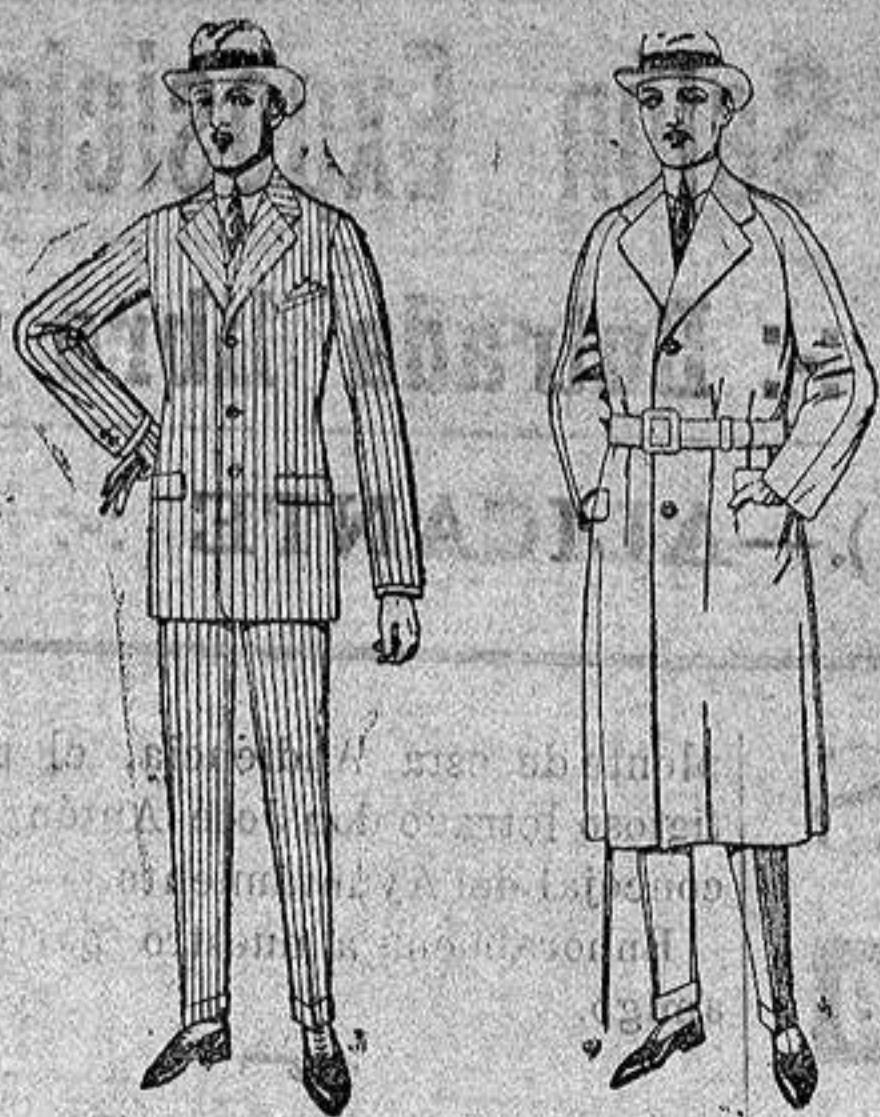
Trajes de melión, cheviot estambre, etc. De ptas. 38 a 150

Sucursales.—Madrid, Barcelona, Almeria, Bilbao, Cadiz, Cartagena, Gijón, Granada, Málaga, Palma de Mallorca, Santander, Sevilla, Valencia, Valladolid, Zaragoza