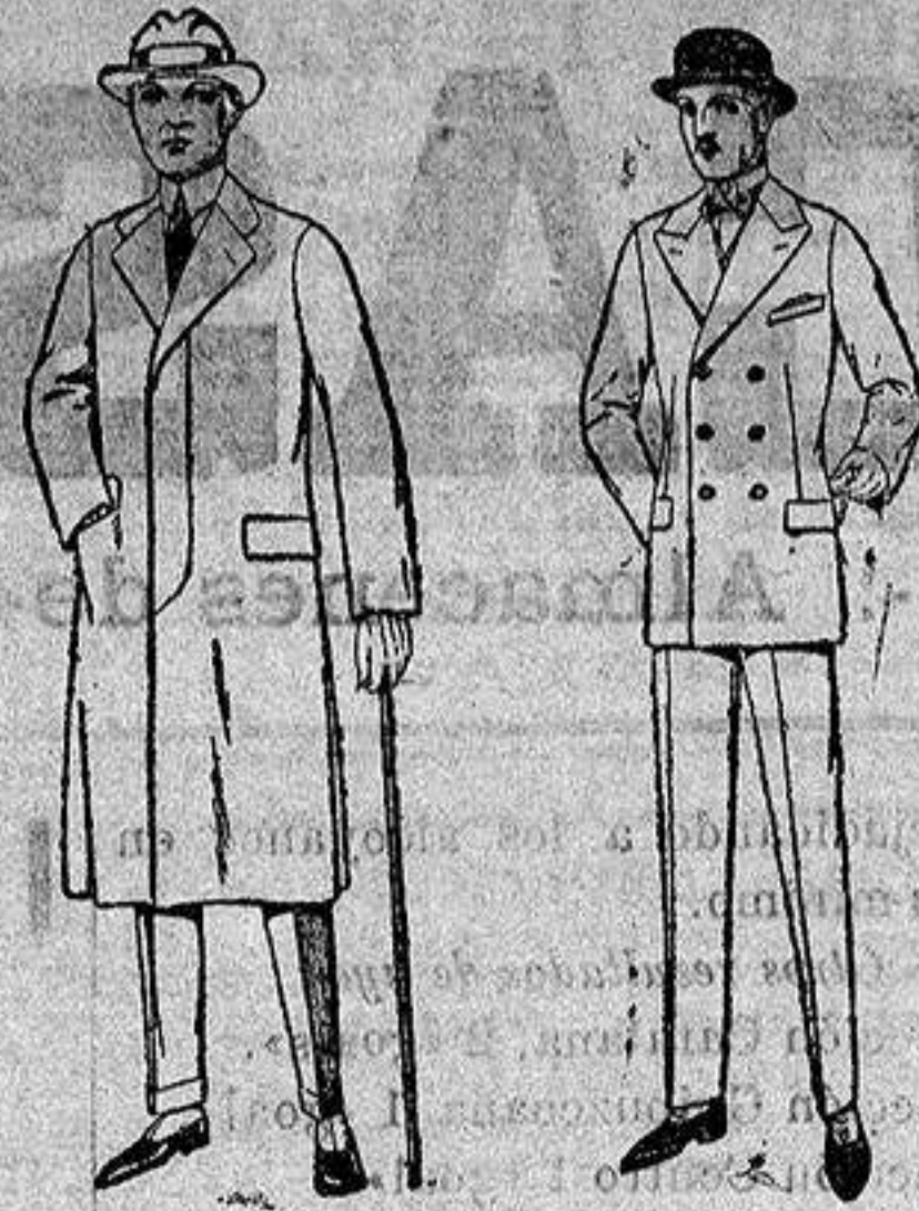
Gabanes de cheviot, gamuza patén etc. De ptas. 45 a 140.