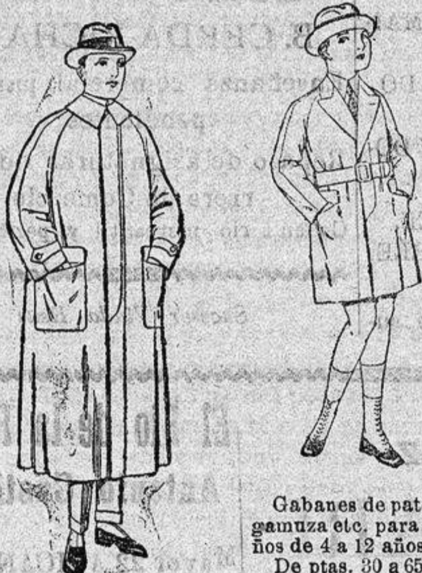
Gabanes de patén gamuza etc. para niños de 4 a 12 años. De ptas. 30 a 65.

Camisería, Géneros de punto, Corbatería Guantería, Sombrerería, Zapatería, Paraguas, Bastones y artículos de viaje