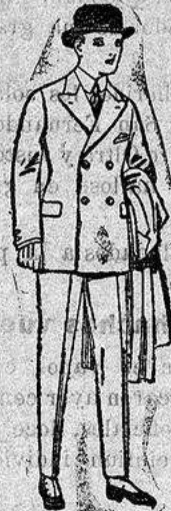
Trajes de patén, y vicuña etc. para niños y jovencitos de diez a dieciséis años. De ptas. 32 a 65