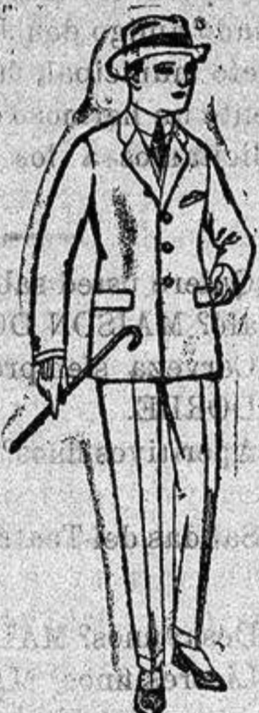
Trajes de patén, vicuña o jerga para niños y jovencitos de diez años a dieciséis. De ptas. 30 a 85.

ULTIMA NOVEDAD en echa manguitos, pelerinas, cort abrigos etc, en pieles de lontr pe, visión renard, zibeline, ar etcétera auténticos e imitación perfecta.