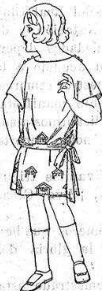
Batas de crespón, en negro y colores, adornos bordados. de ptas. 32 a 33