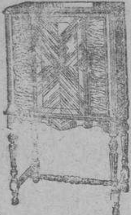
1900 ptas con válvulas