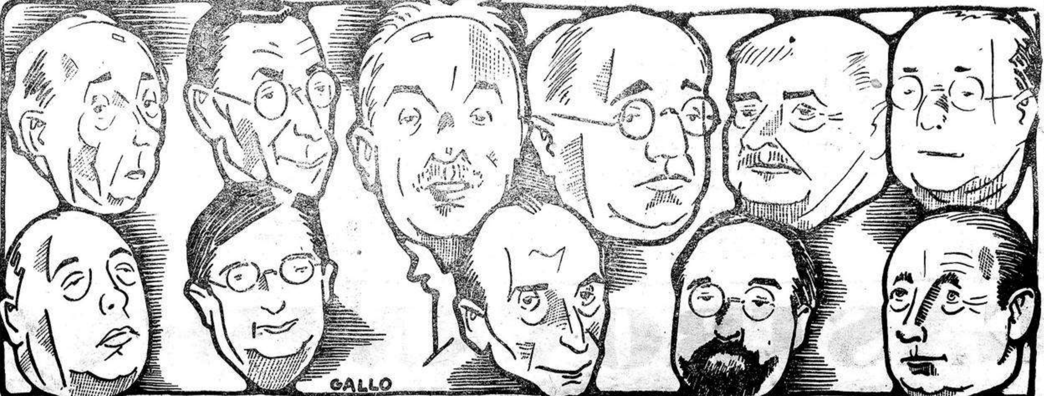
LOS HOMBRES DE LA REPUBLICA. — S. E. EL PRESIDENTE, y LOS MINISTROS, SEGUN EL LAPIZ DE GALLO.

N. de la R. — El anterior artículo nos lo entregó el autor para publicarlo el 14 de abril. La circunstancia de haber hecho fiesta ayer y retrasar hasta hoy este número, hace que se publique en EL LUCHADOR con una hora de retraso.