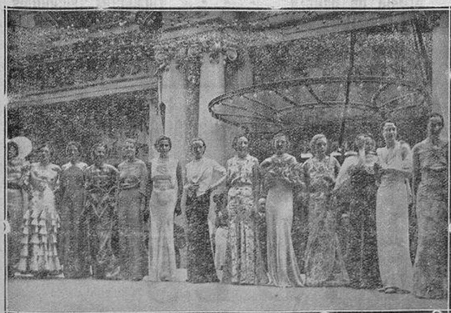
En el gran Prado Catalán de París, ha tenido lugar ante una numerosa y elegante concurrencia la elección de las señoritas maniqués más bellas y elegantes de París. Desfile de las maniqués.