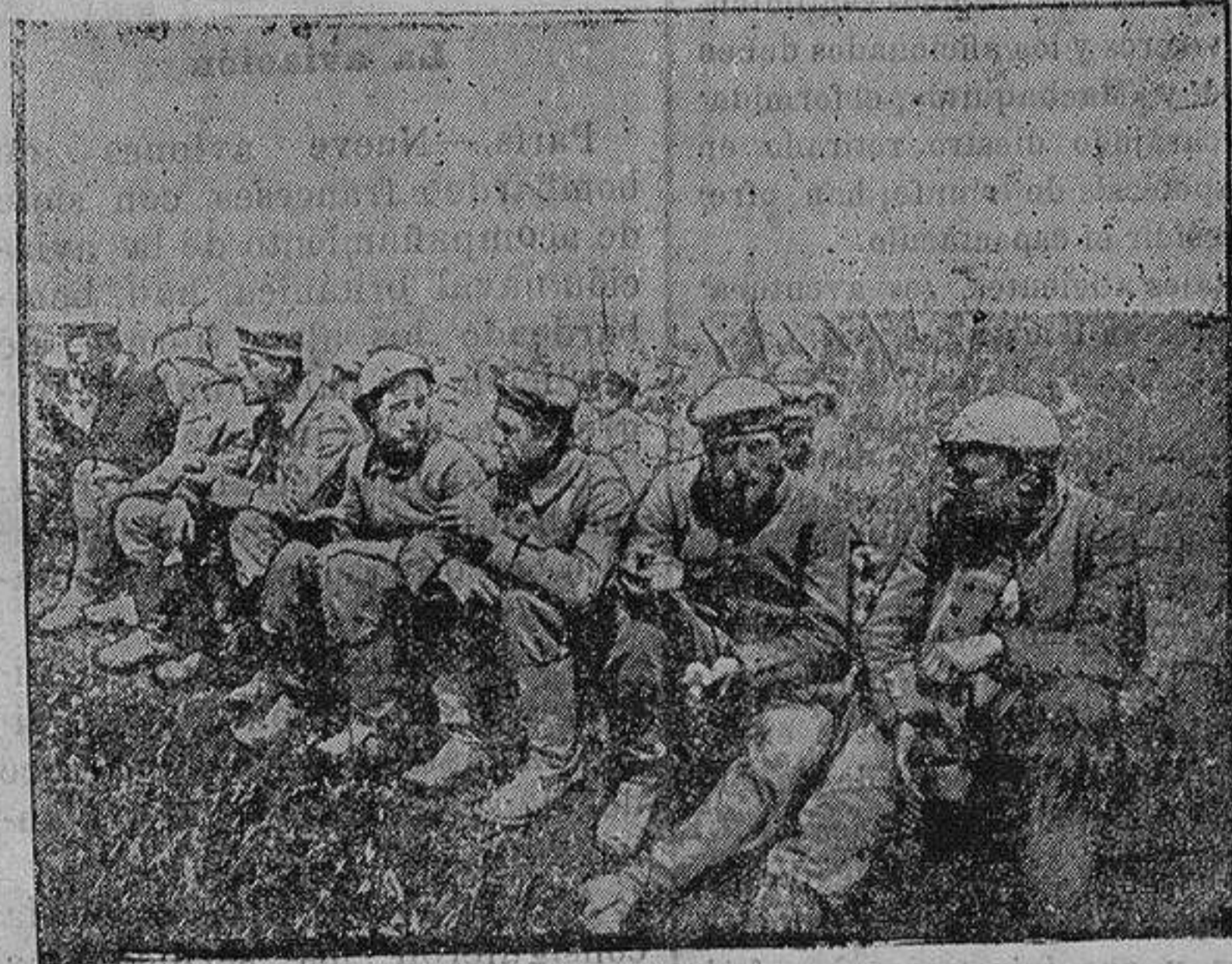
Del frente aliado.—Soldados tomando el desayuno