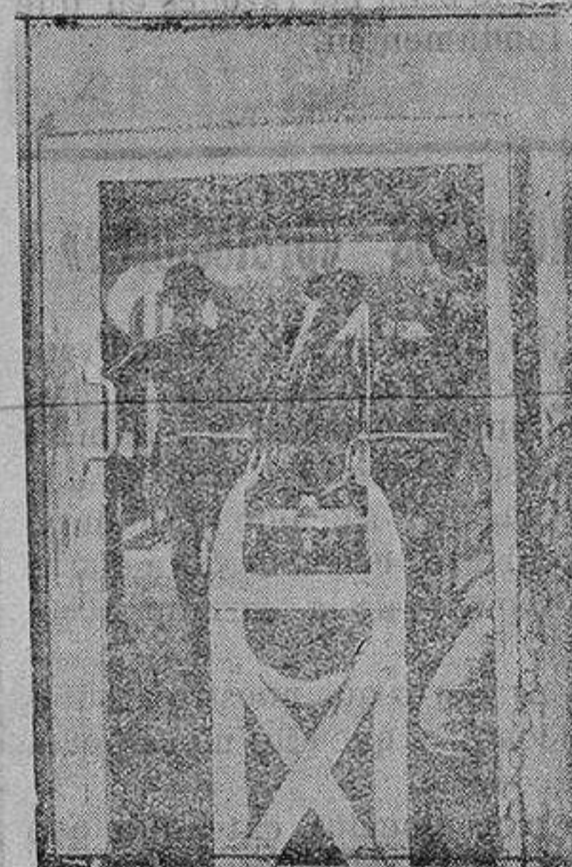
Detalle interior de un tren blindado

Se cree que será en la próxima primavera.