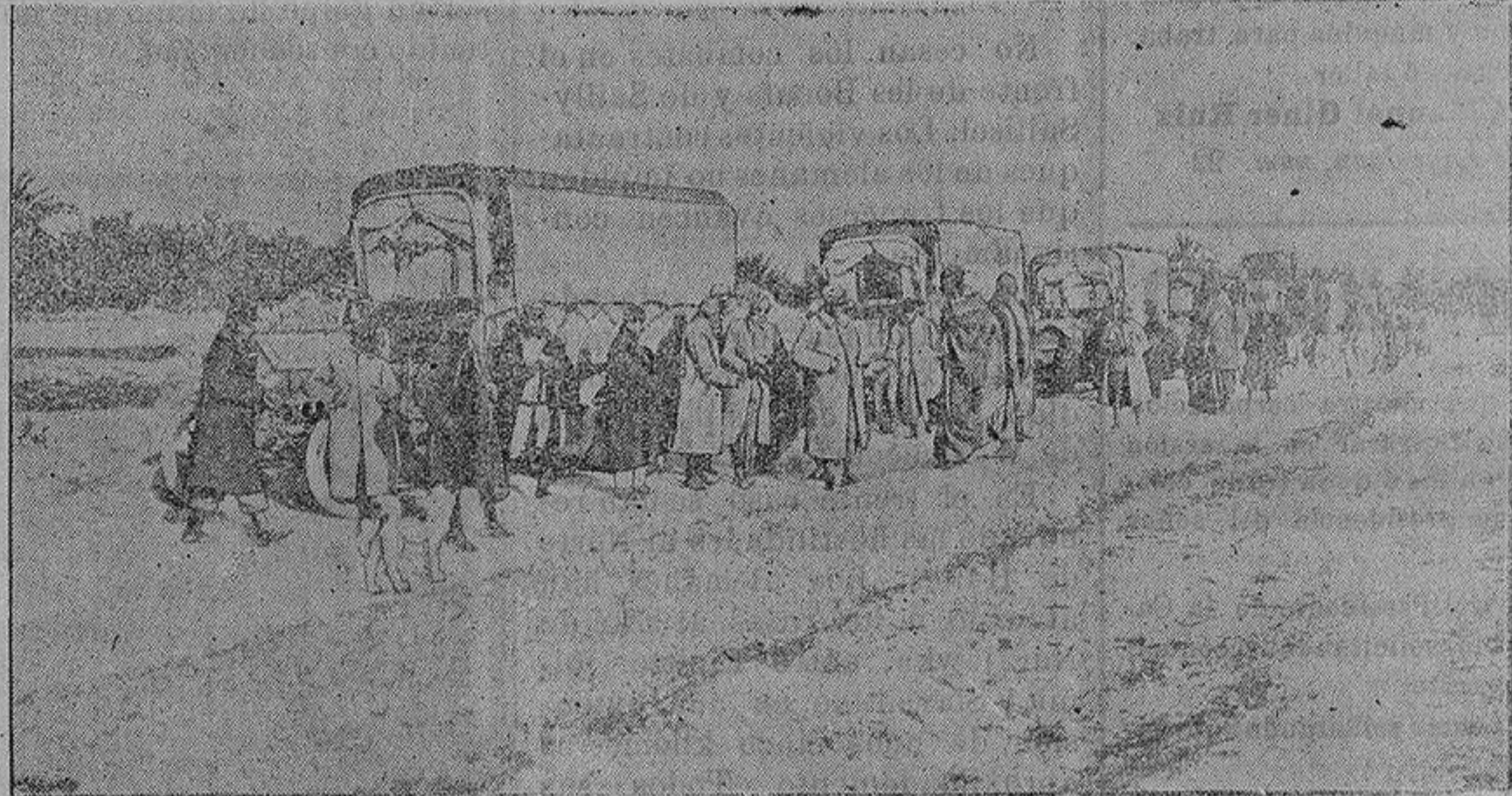
Un campamento francés cerca de Salónica

Pero por lo pronto esa juventud, en la edad en que las ideas políticas y las pasiones amorosas se sienten con sinceridad y hacen que nos guste lo bueno y lo bello, lo que supone luchas y contrariedades, en esa edad, repetimos, el estudiante era, por regla general, defensor de las aspiraciones más avanzadas. Antes en sus revueltas entonaban