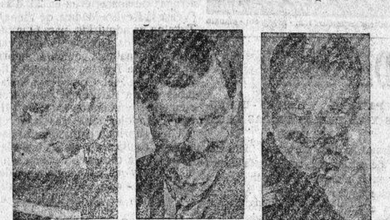
Usted lector que conoce bien todas las figuras de la pantalla puede decir quien es cada uno? A ver si lo acierta.