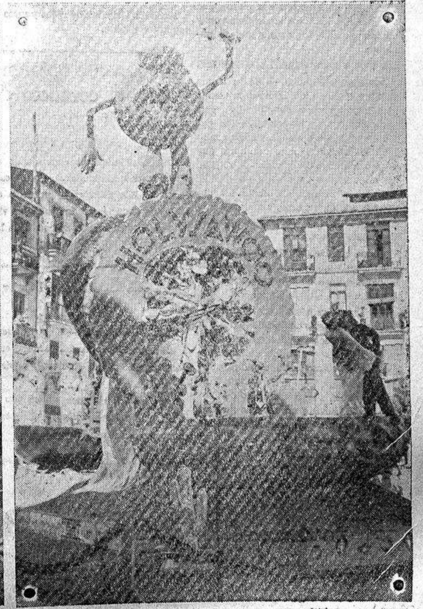
SEGUNDA SECCION. — FALLA DE LA PLAZA DE ROJAS CLEMENTE, QUE OBTUVO EL PRIMER PREMIO (1.000 PESETAS)