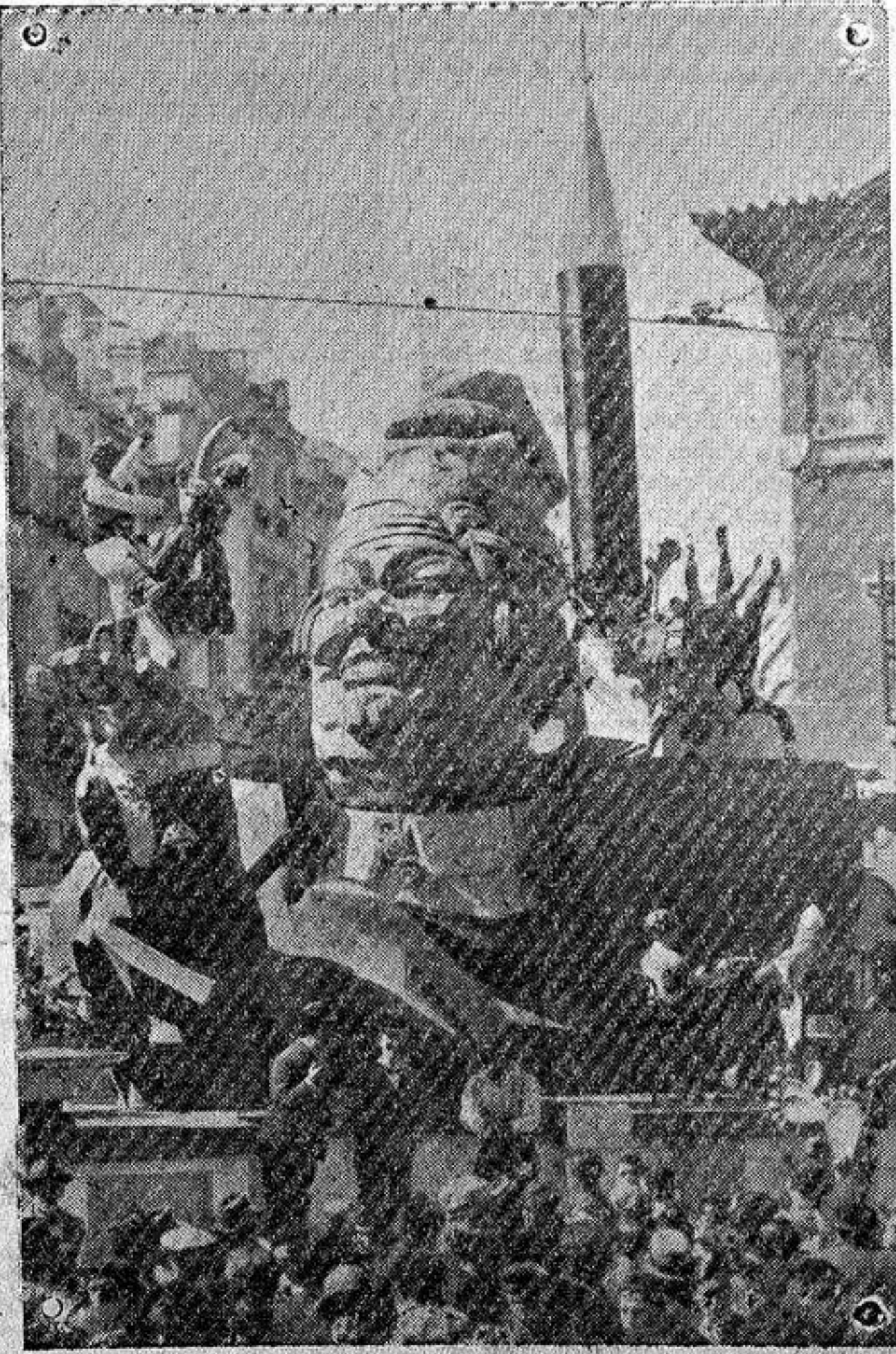
PRIMERA SECCION. — FALLA DE LA PLAZA DEL MERCADO, QUE OBTUVO EL SEGUNDO PREMIO (2.000 PESETAS). AUTOR, V. BENEDITO