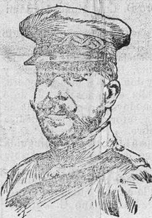
El General Aguilera destinado a mandar las fuerzas de Tetuán-Lauzién