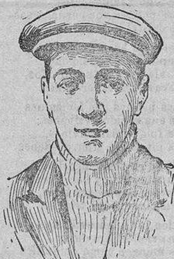
El aviador Perrayon que elevándose a seis mil metros ha batió el record de altura

Los trabajos se remitirán en la forma de costumbre antes de las doce del día 15 de Abril. El fallo se hará público antes del día 31 de dicho mes.