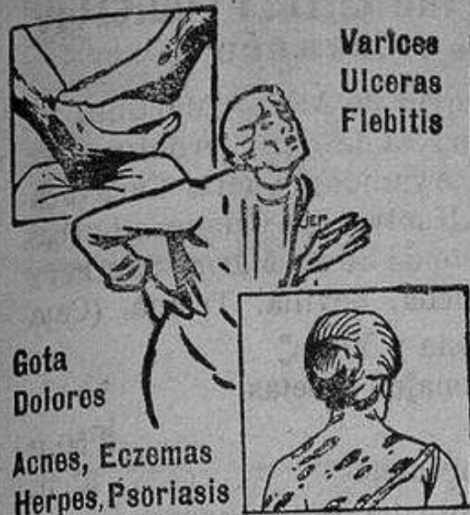
Varices Ulcera Flebitis

BOTELLA Tuberías y accesorios TIPOGRAFIA EL LUCHADOR