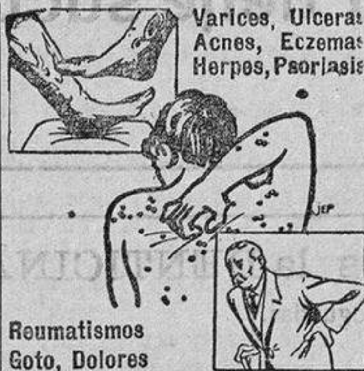
Varices, Ulceras, Acnes, Eczemas, Herpes, Psoriasis

El reglamento del Estado fiscal del que dió lectura el Ministro de Gracia y Justicia, fué redactado por una comisión nombrada al efecto y será llevada por el Ministro a la firma del Rey, en su despacho del lunes.