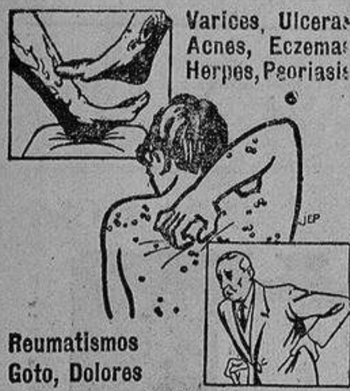
Varices, Ulceras, Acnes, Eczemas, Herpes, Psoriasis

Pídase en todas las farmacias y droguerías y exijan la cajita REGALO