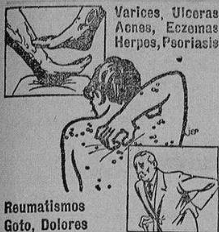
Varices, Úlceras, Acnes, Eczemas, Herpes, Psoriasis

Pídase en todas las farmacias y droguerías y exijan la cajita REGALO