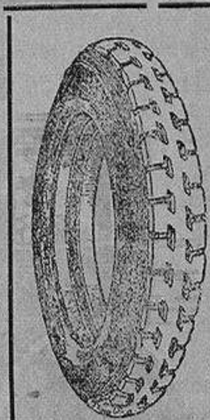
La cubierta recauchutada que le devuelve la fábrica.

que si usted adquiriera una cubierta nueva le dejaremos la que nos entregue para recorrer 20.000 kilómetros más.