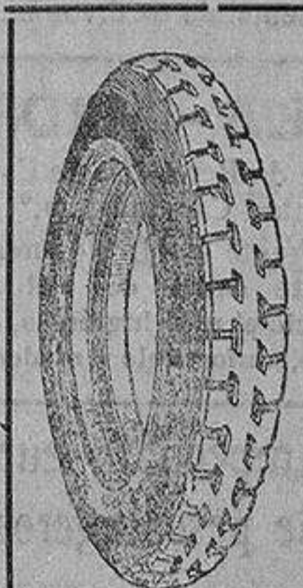
La cubierta recauchutada que le devuelve la fábrica.

que si usted adquiriera una cubierta nueva le dejaremos la que nos entregue rota para recorrer 20.000 kilómetros más.