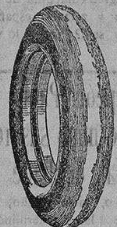
La cubierta inservible que usted nos entrega

las cubiertas viejas de su automóvil. Aunque estén inútiles e inservibles se las dejaremos nuevas