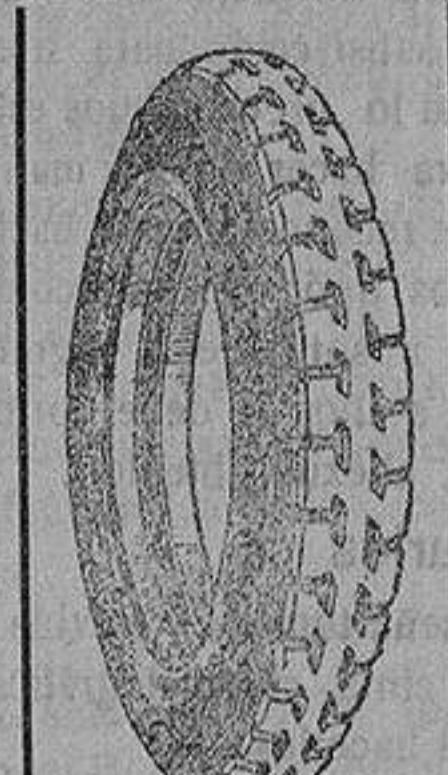
La cubierta recauchutada que le devuelve la fábrica.

que si usted adquiriera una cubierta nueva le dejaremos la que nos entregue rota para recorrer 20.000 kilómetros más.