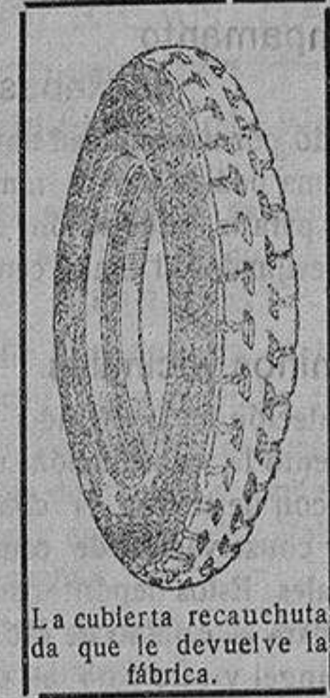
La cubierta recauchutada que le devuelve la fábrica.

que si usted adquiriera una cubierta nueva le dejaremos la que nos entregue rota para recorrer 20.000 kilómetros más.