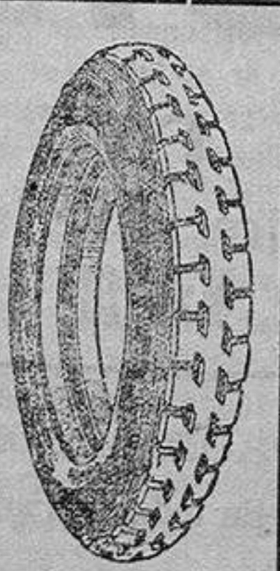
La cubierta recauchutada que le devuelve la fábrica.

que si usted adquiriera una cubierta nueva le dejaríamos la que nos entregue rota para recorrer 20.000 kilómetros más.