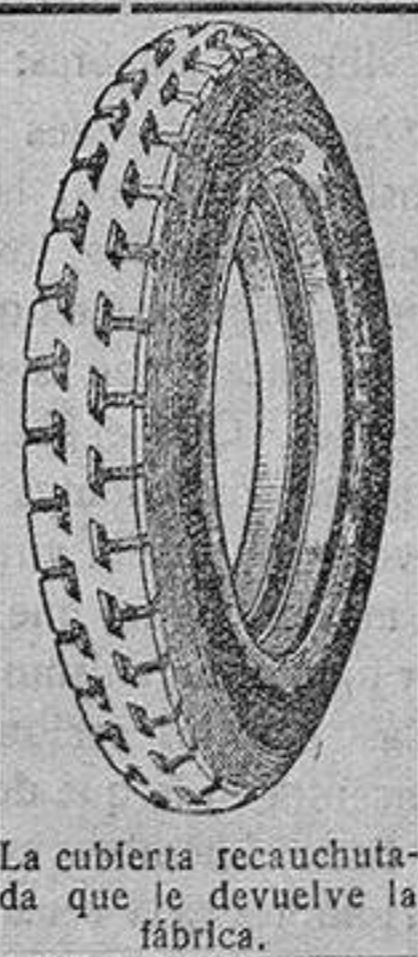
La cubierta recauchutada que le devuelve la fábrica.

que si usted adquiriera una cubierta nueva le dejaremos la que nos entregue rota para recorrer 20.000 kilómetros más.