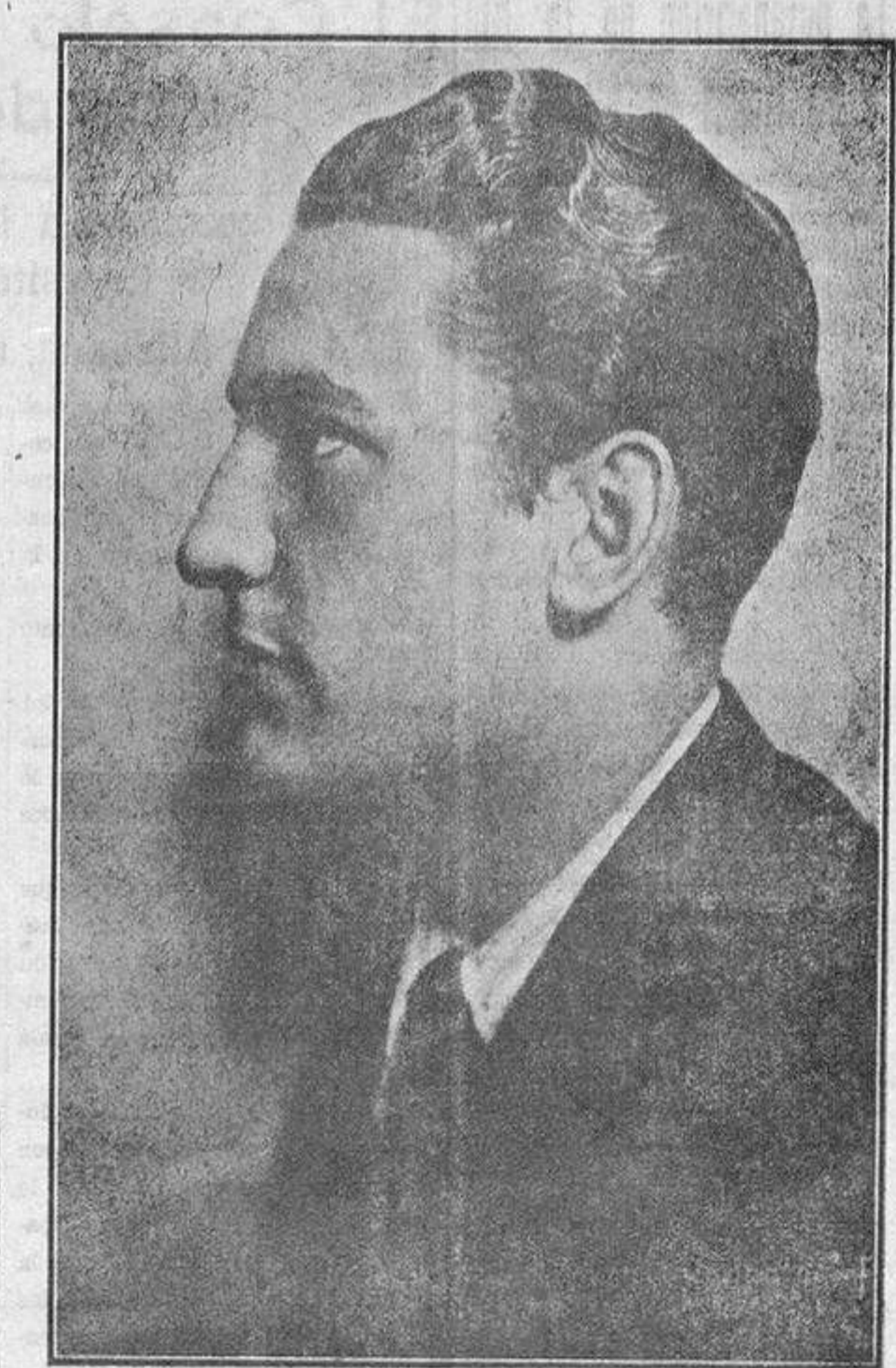
El barítono alicantino Pedro Sánchez Terol