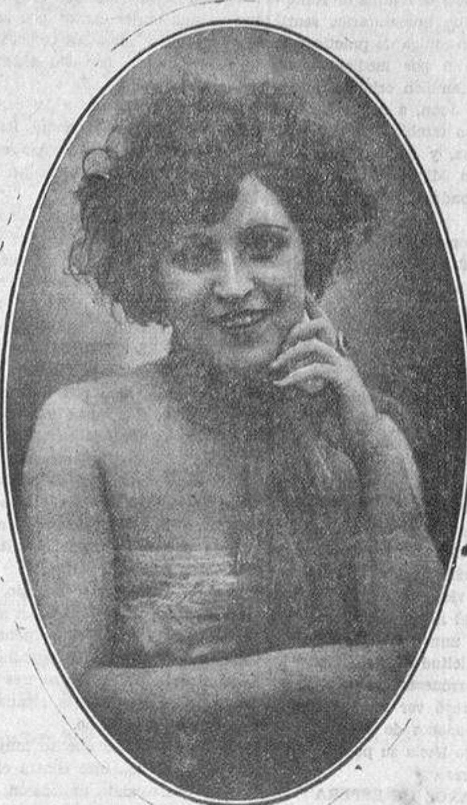
GRACIA, Y ESCULTURA EN SU CUERPO MAGNÍFICO. ESO ES LA «VEDETTE» DE LA COMPANIA DE REVISTAS DEL «FUENCARRAL» QUE EL VIERNES DEBUTA EN EL TEATRO MONUMENTAL, DE ALICANTE.