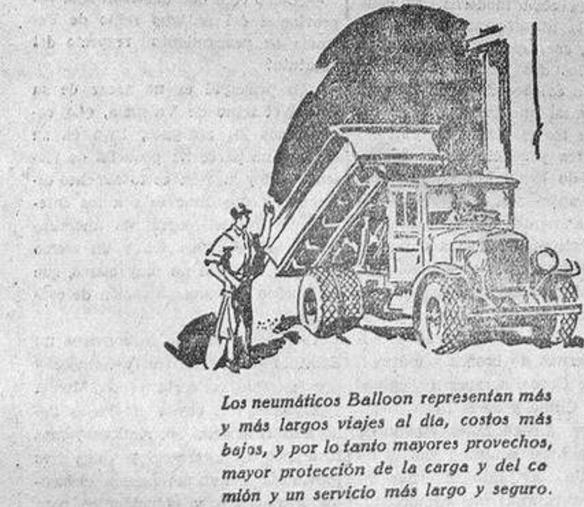
Los neumáticos Balloon representan más y más largos viajes al día, costos más bajos, y por lo tanto mayores provechos, mayor protección de la carga y del camión y un servicio más largo y seguro.