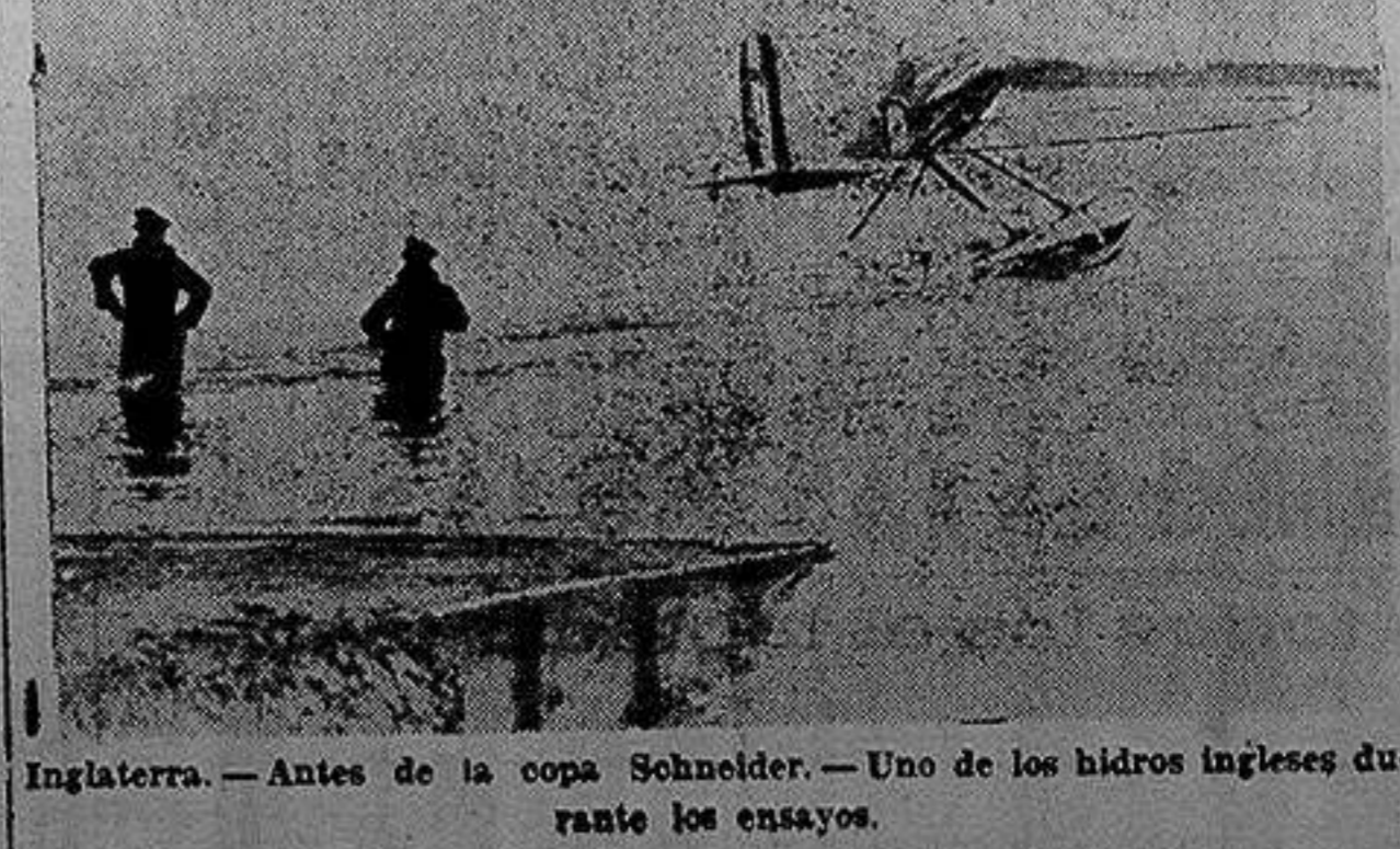
Inglaterra. — Antes de la copa Schneider. — Uno de los hidros ingleses durante los ensayos.