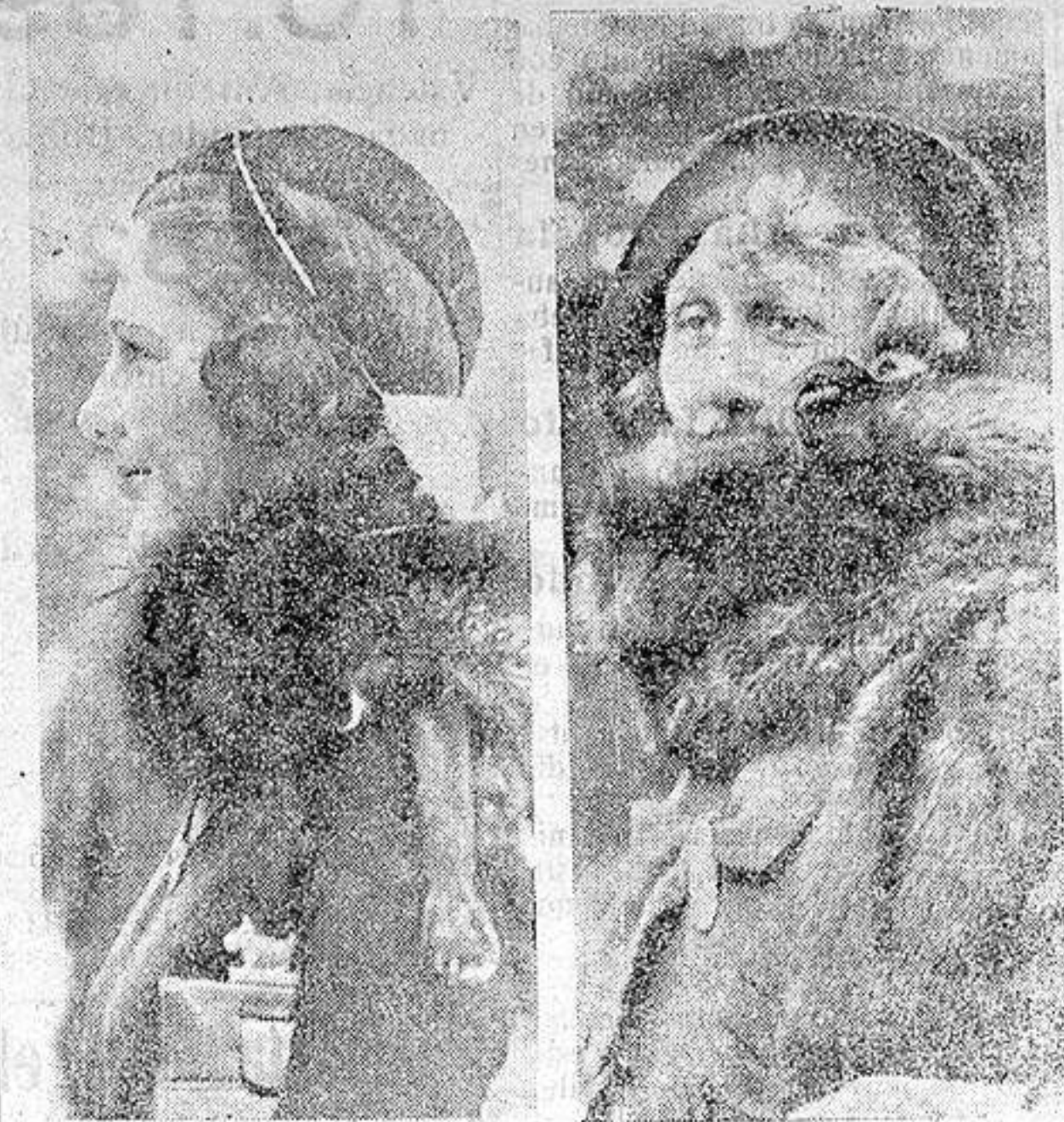
La Moda.—Cual de estas dos tendencias triunfará este invierno: el sombrero graciosamente inclinado sobre el ojo o el bonete colocado hacia atrás?

Y los amantes de la naturaleza, que por suerte cada día son más numerosos, han creído que eso no debía continuar así. Por eso se han organizado y cerca de los poderes