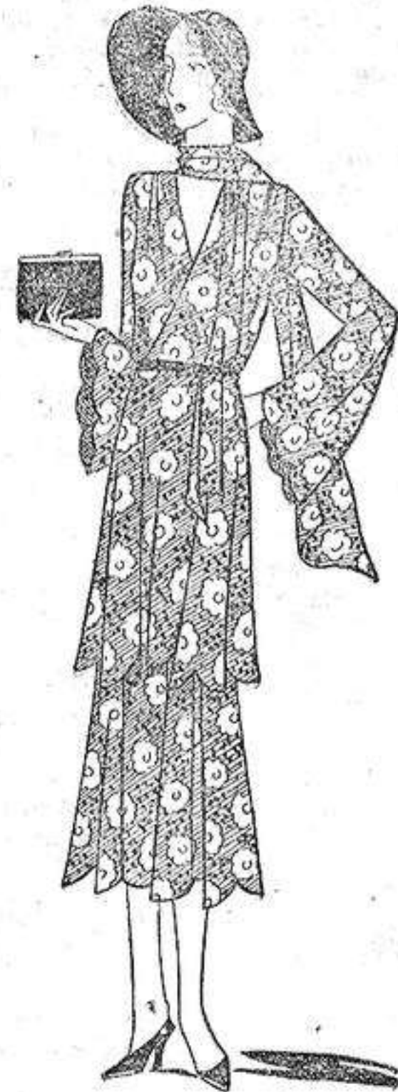
Vestido de muselina impresa con diferentes tonos, falda con dos volantes.