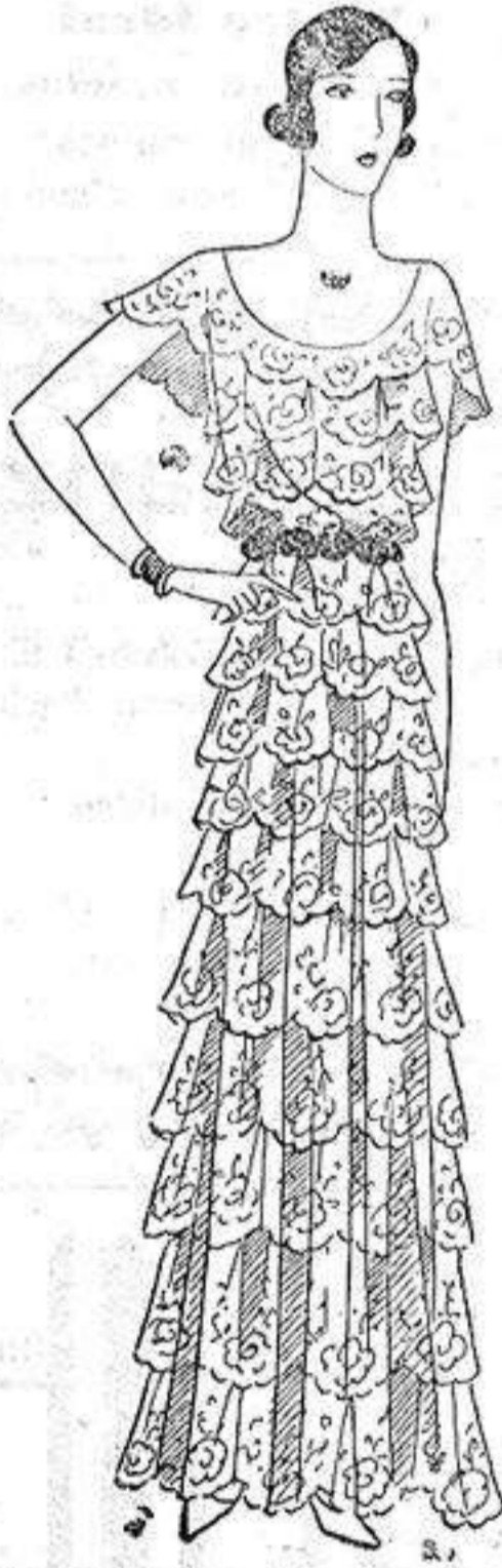
Vestido de jovenzita, de volantes de valenciana, sobre muselina rosa...