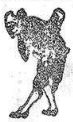
A los pies de Vd.

El maravilloso baño de pies PEDYKUR ha conseguido hacer andar sin sufrir a cientos alicantinos lo han usado, pues permite llevar el calzado ajustado sin que se hinchen, recalienten o duelean los pies, juanetes, o callos por mucho que se ande, gracias a que aumenta considerablemente su resistencia al cansancio y al calor. Vea usted estas pruebas recientes: