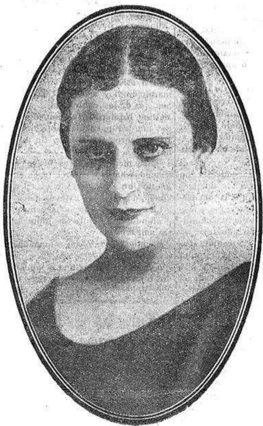
Camila Quiroga, la eminente actriz argentina que debuta el sábado en el Teatro Principal