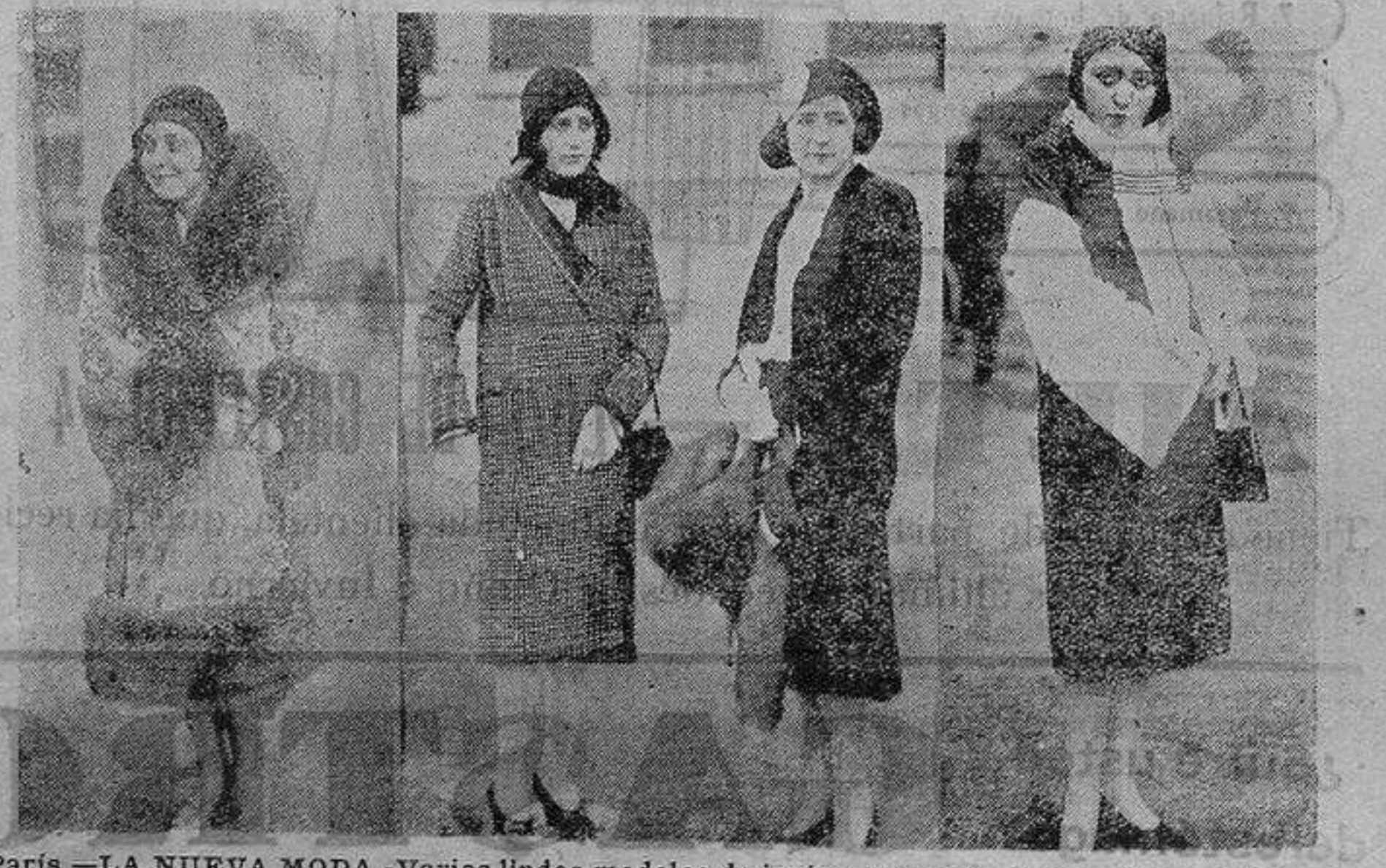
Paris.—LA NUEVA MODA.—Varios lindos modelos de invierno en el «passage» de Longchamp.

Entre otras cosas dice que ha inventado un procedimiento para el cierre automático de los pasos