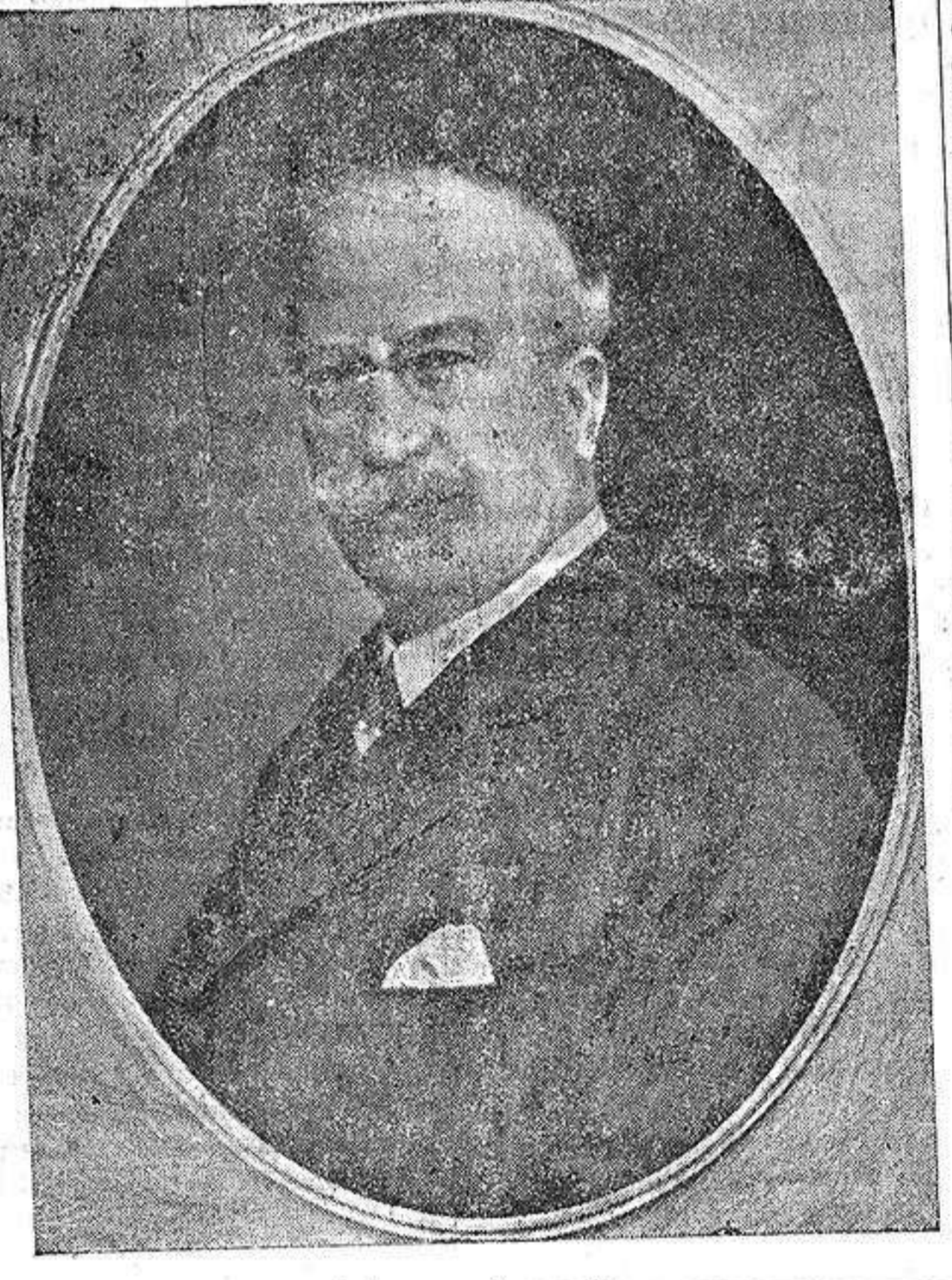
Don Alejandro Lerroux

Representa a la Derecha liberal republicana. Comienza con extraordinaria de la actitud del gobernador condicionando la hora de celebrar este mitin y de que teman la obscuridad quienes vegetan y encuentran en ella el único motivo de su existencia. (Grandes aplausos). Justifica su evolución desde el puesto de «hijo encasillado» hasta el de honor, que hoy significa estar en el campo republicano. No son amargados. Lo que ocurre es que se han deslindado los campos: de un lado los del «borrón y cuenta nueva», los monárquicos; de otro, los que van a exigir responsabilidades, los republicanos. Y responsabilidades a todos, por altos que se hallen. Extiéndese en acertadas consideraciones sobre la responsabilidad que corresponde a la Corona, amparadora de la dictadura. No le interesa si además tenía conocimiento del movimiento. Es suficiente que lo aceptara. Los jefes de Estado no pueden ser prisioneros de los ejércitos sublevados. (Ovación). Insiste en este tema y al solici-