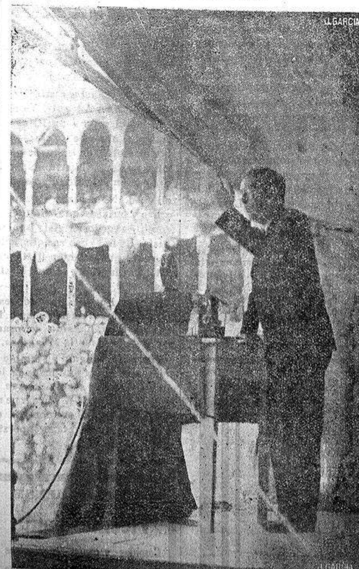
El ilustre tribuno don Marcelino Domingo durante su interesante discurso en el mitin de solidaridad republicana celebrado el domingo.