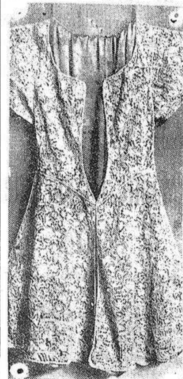
Paris.—La Exposición de encajes antiguos, en el Museo de Cluny.—He aquí la pieza más bella de la Exposición: un vestido de encaje español, del siglo XVII

En cuanto a colores, nos limitaremos a decir que en estos días hemos podido observar una tendencia muy señalada al predominio del verde. Esta moda se pro-