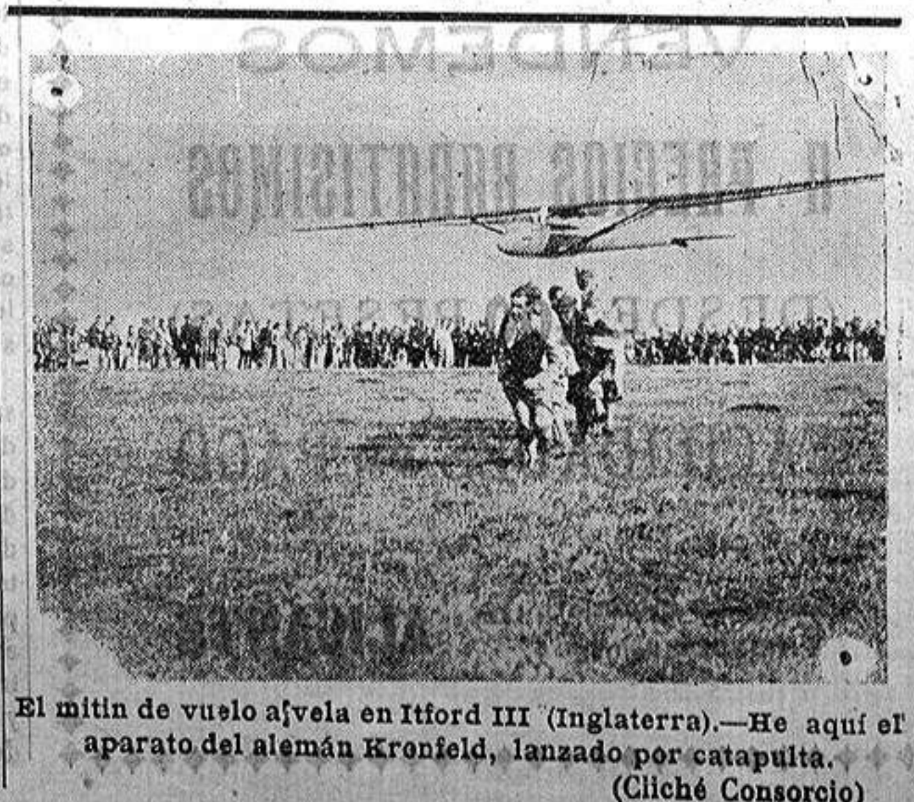
El mitin de vuelo afvela en Itford III (Inglaterra).—He aquí el aparato del alemán Kronfeld, lanzado por catapultilla.

La comisión agradeció al ministro de Marina el interés que pone en acceder a las peticiones presentadas, y de la entrevista salieron muy satisfechos.