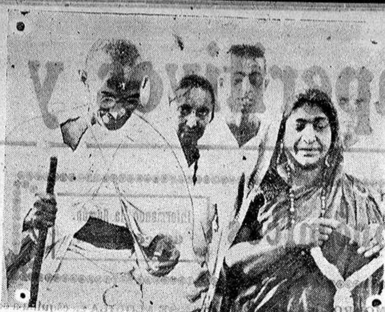
Una instantánea de Gandhi y de la señora Sarajini Naidu, ambos jefes del movimiento insurreccional indio.

C. J. A. P.—Mundo Latino—Príncipe de Vergara 42 y 44 Madrid.