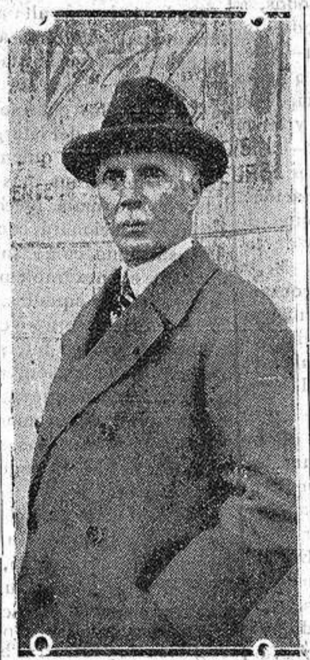
Monsieur Henri Farman, inventor and constructor of aeroplanes, photographed in front of the monument erected in his honor in Issy les Moulinaux, commemorating the first kilometre travelled in an aeroplane.