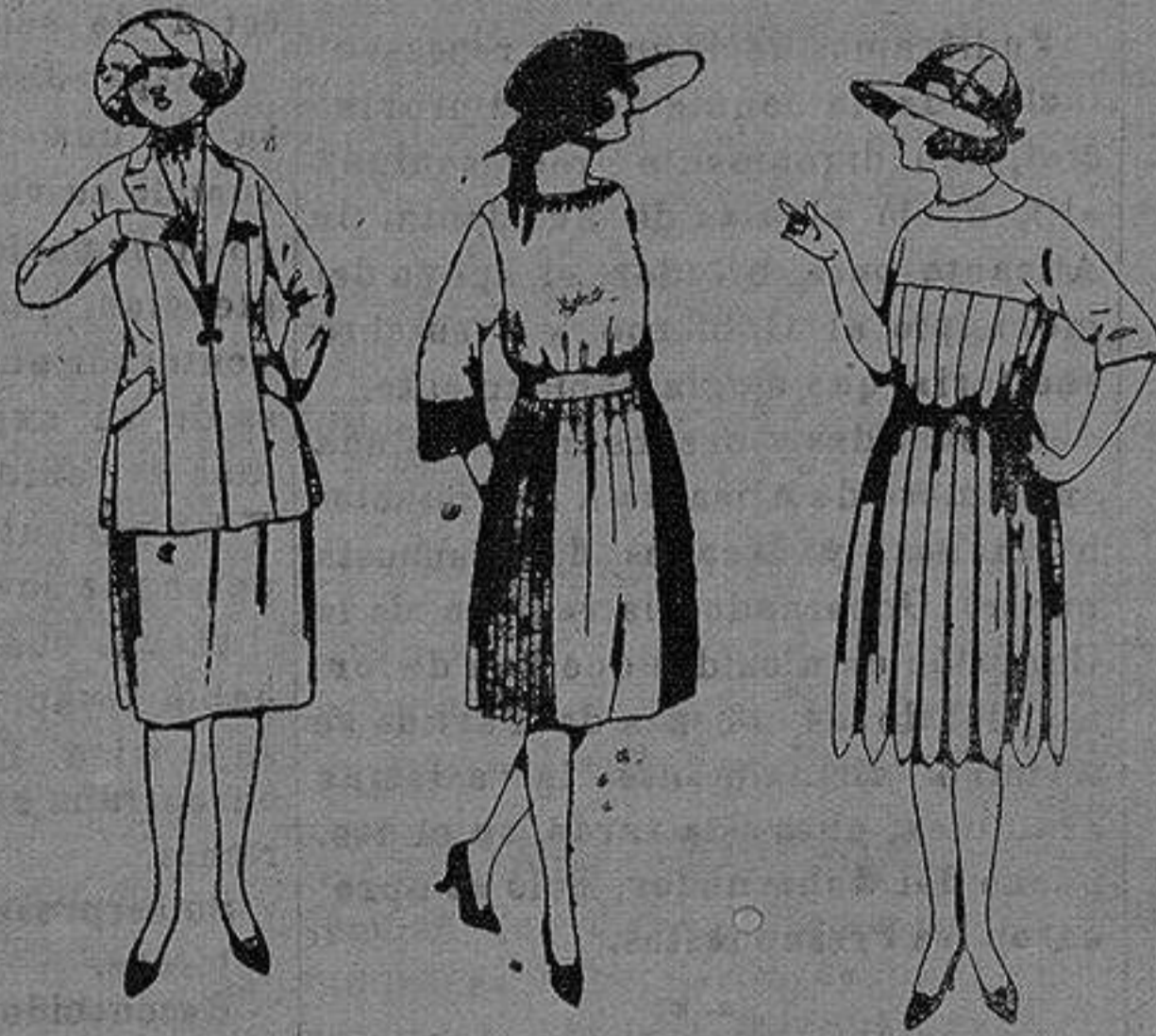
Trajes de sarga inglesa, gabardina etc., en azul y color. de ptas. 85 a 100