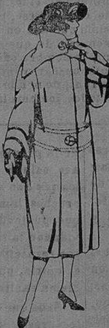
Abrigos de terciopelo de lana, ratina, etc., en negro, azul color, adornos pespunte seda de ptas. 120 a 200