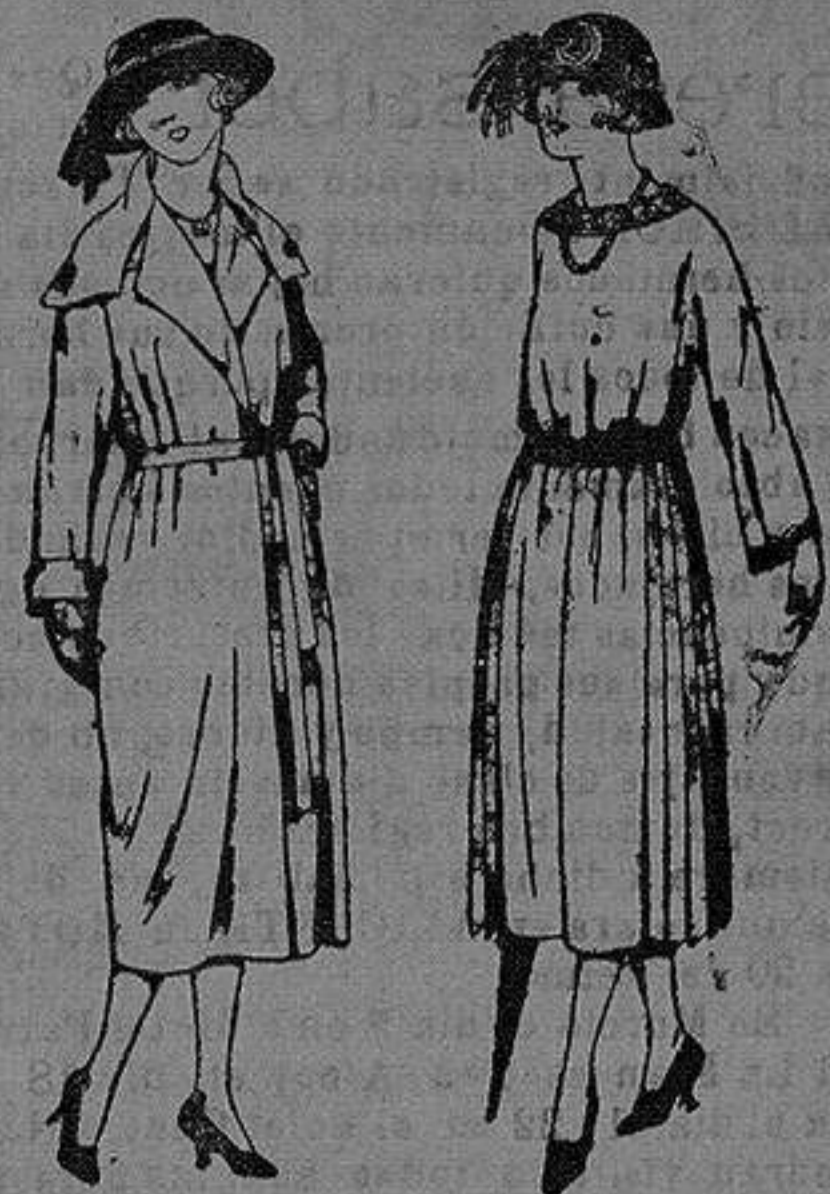
Abrigos de gamuza, cheviot, etc., en negro, azul y color. de ptas 50 a 100