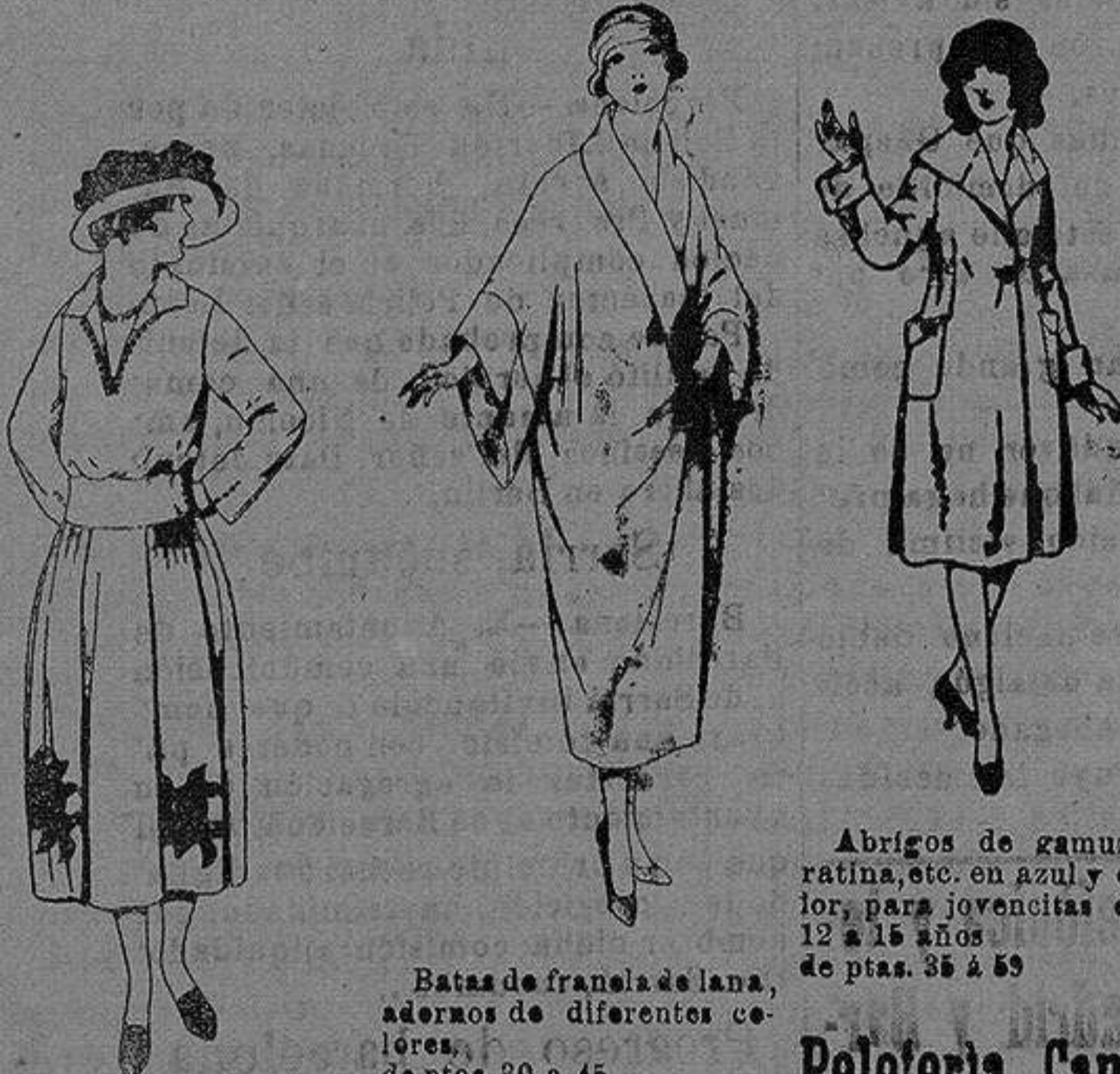
Abrigos de gamuza ratina, etc. en azul y color, para jovencitas de 12 a 15 años de ptas. 35 a 50