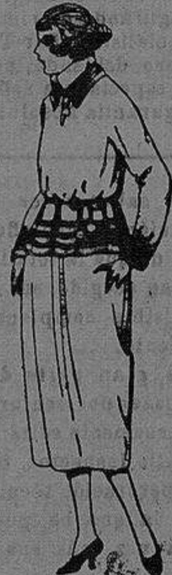
Paletots de punto de lana, hechos a mano. de ptas. 1750 a 25

Peletería, Camisería Géneros de punto, Corbatería, Guantería, Sombrerería, Zapatería, Paraguas Bastones y Artículos de Viaje