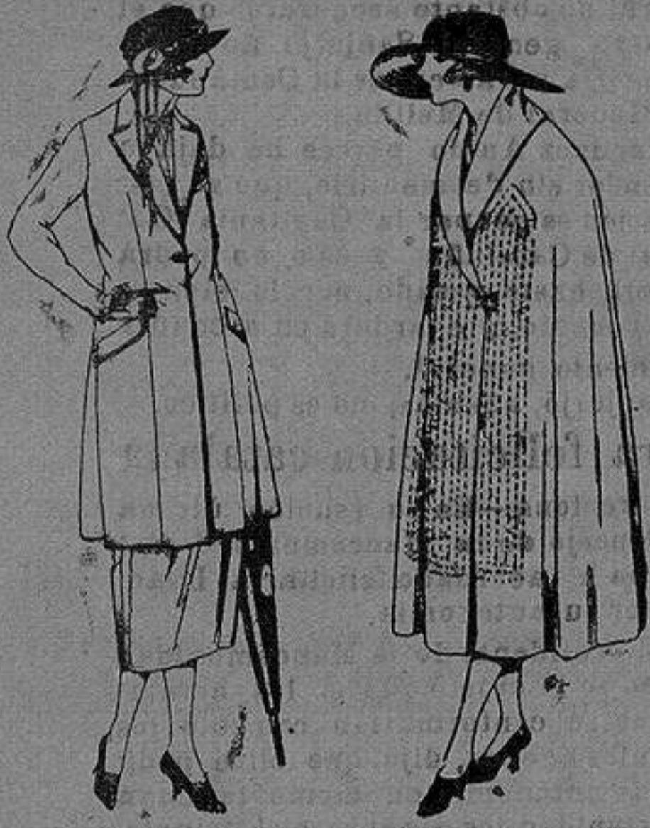
Tresjes de sarga inglesa, heviot, en negro azul y color. de pta 140 a 200.

Altamira, 2 :: Alicante :: Victoria, 1 Sucursales: Madrid, Barcelona, Almeria, Bilbao, Cadiz, Cartagena, Gijón, Granada, Málaga, Palma de Mallorca, Santander, Sevilla, Valencia, Valladolid, Zaragoza