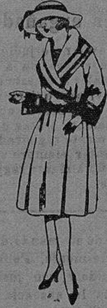
Abrigos de terciopelo de lana, gamuza, etc., en negro, azul y color, para jovencitas de 12 a 15 años. de ptas. 55 a 95

Ropas confeccionadas para Caballero, Señora, Niño y Niña