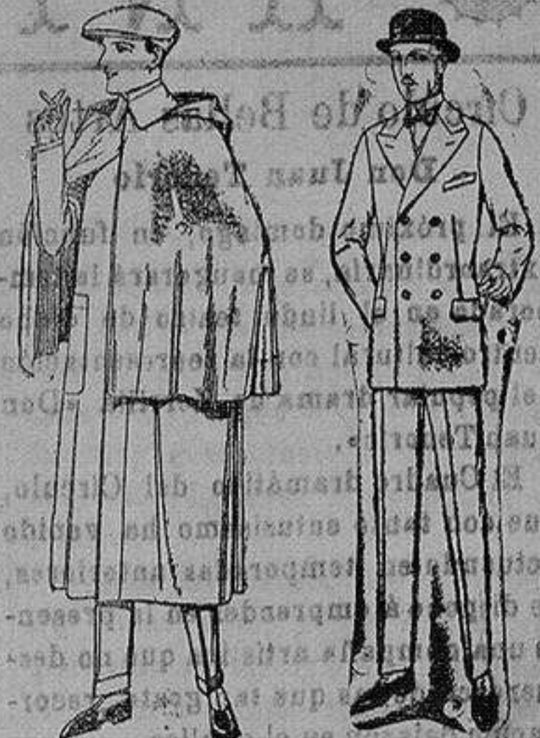
Impermeables mack-ferland en negro y azul de ptas. 85 a 167 Trajes de mel-ton, cheviot, es-tambre, vicuña o jerga. de ptas. 50 a 175