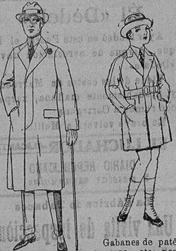
Gabanes de patén gamuza, etc. para niños y jovencitos de 10 a 16 años. de ptas. 30 a 75 Gabanes de che-viot gamuza o patén etcétera. de ptas. 45 a 140