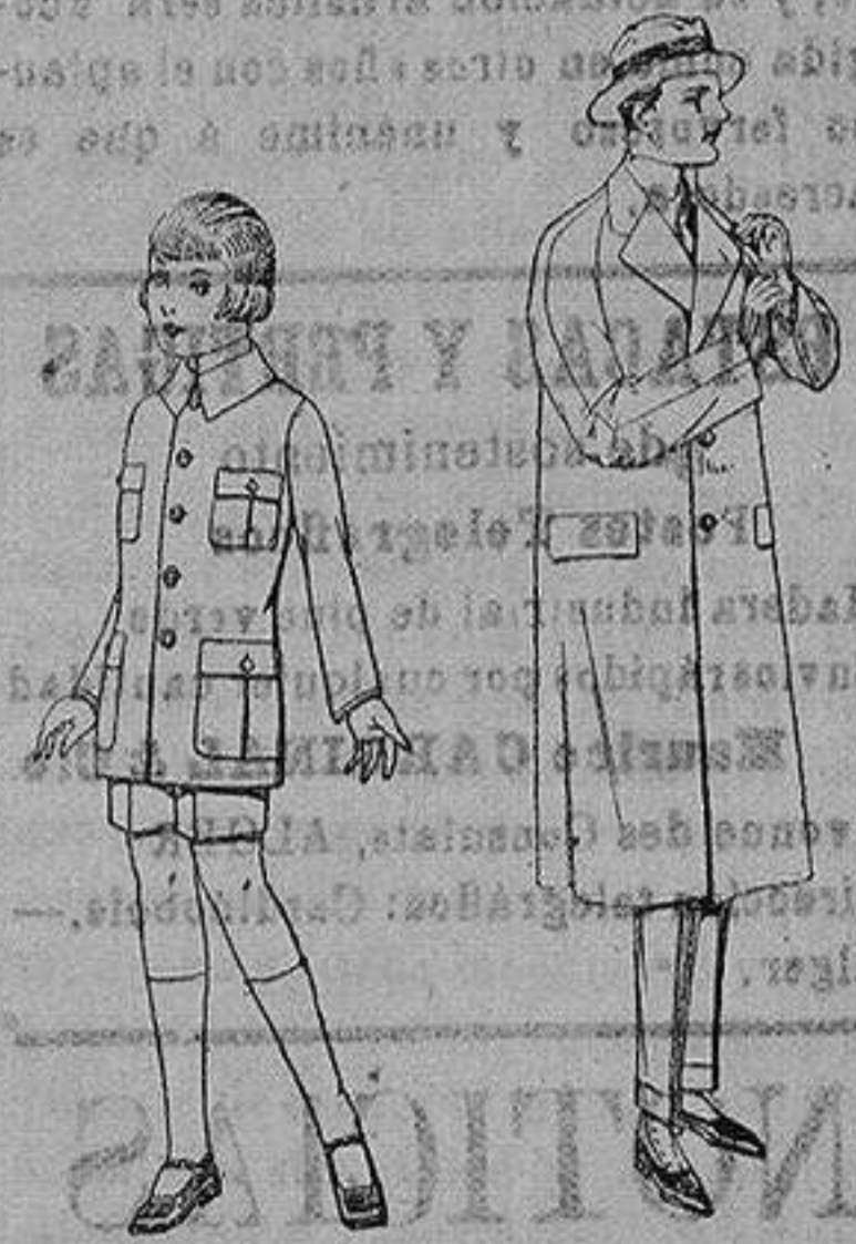
Trajes de patén módelo Sport, para niños de 4 a 9 años. de ptas. 22 a 35. Gabanes raglände de patén, mel-ton, cheviot, con fer-ro de seda o satén. de ptas. 60 a 160

Ropas confeccionadas para Caballero, Señora, Niño y Niña