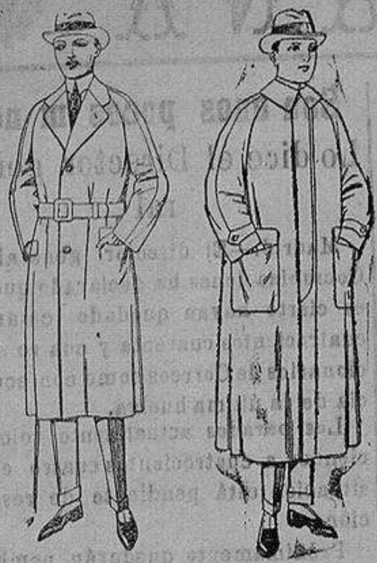
Gabanes raglände patén, gamusa o co-wer. de ptas. 75 a 200 Impermeables raglände en azul y colores. de ptas. 82 a 170

Sucursales: Madrid, Barcelona, Almeria, Bilbao, Cadiz, Cartagena, Gijón, Granada, Málaga, Palma de Mallorca, Santander, Sevilla, Valencia, Valladolid, Zaragoza