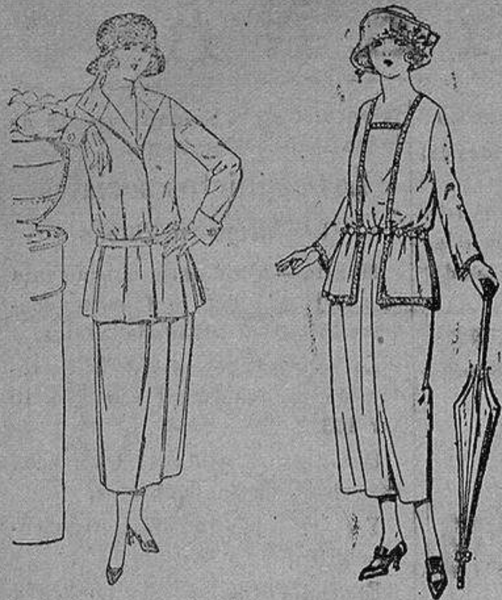
Traje sastre de estambre gabardina, etc., chaqueta forrada de seda, en negro marino y colores moda. de ptas. 115 a 145

Sucursales: Madrid, Barcelona, Almeria, Bilbao, Cadiz, Cartagena, Gijón, Granada, Málaga, Palma de Mallorca, Santander, Sevilla, Valencia, Valladolid, Zaragoza