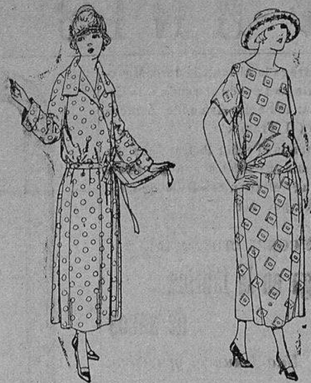
Batas de percal, voile listado, etcétera. de ptas. 16 a 28