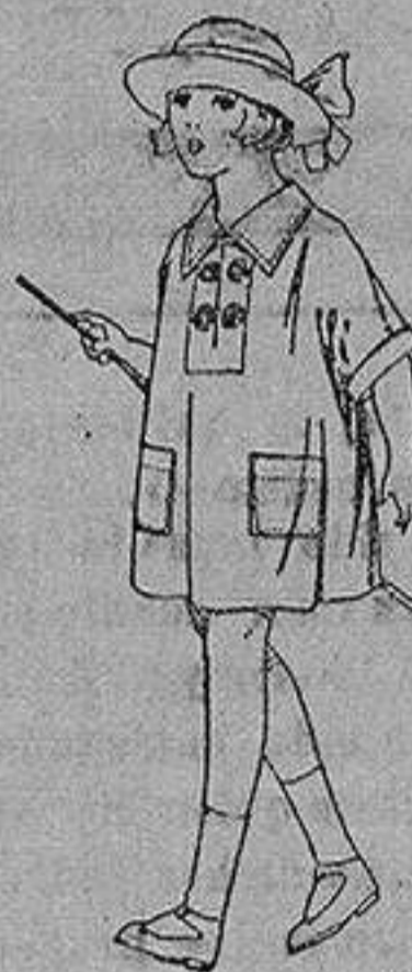
Vestidos de batista blanca, adornos bordados, para niñas de 3 a 6 años de ptas. 6 a 8

Boas, Camisería, Géneros de punto Corbatería, Guantería, Sombrerería Zapatería, Paraguas Bastones y Artículos de Viaje