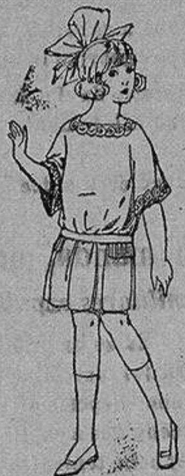
Vestido de sarga popelina inglesa, en azul y colores moda, para niñas de 4 a 9 años. de ptas. 33 a 38

Ropas confeccionadas para Caballero, Señora, Niño y Niña