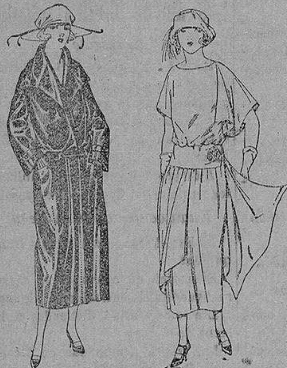
Abriego de seda impermeables, en negro, azul y color. de ptas. 130 a 225